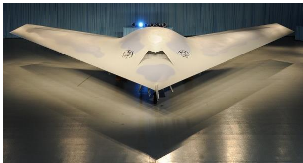
Рис. 6. БПЛА Phantom Ray

рити бойові можливості ударного БПЛА та максимально інтегрувати його в загальну бойову систему для виконання завдань згідно концепції “мережецентричних війн” [7, 9, 10, 11]. Так, наприкінці 2012 року в США приступили до випробувань перспективного БПЛА Phantom Ray (рис. 6).