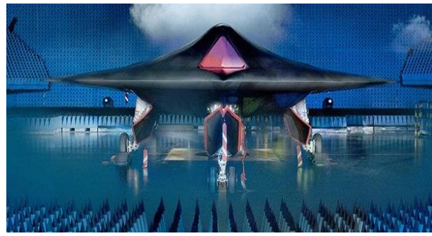
Рис. 12. БПЛА Taranis (Громовержець)

Згідно попередніх планів, БПЛА Taranis с часом може прийти на зміну літака Tornado GR4.