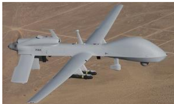
Рис. 2. БПЛА MQ-1C Gray Eagle (Сирій орел)