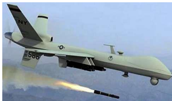
Рис. 3. БПЛА MQ-9 Reaper (Жнець)

Перші комплекси БПЛА RQ-1 Predator поступили на озброєння в 1995 році і відразу розпочалося їх застосування на Балканах.