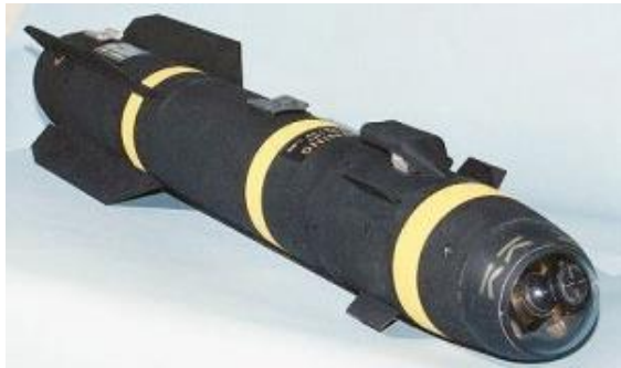
Рис. 4. Ракета AGM-114 Hellfire II

роблялася з середини 1970-х років для використання з різних носіїв, але основним призначенням комплексу є озброєння бойових вертольотів. На озброєння армії та корпусу морської піхоти США ракета AGM-114 Hellfire була прийнята в 1984 році [8].