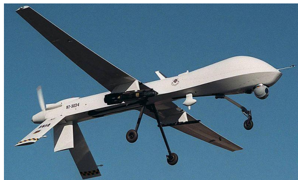
Рис. 1. БПЛА MQ-1 Predator (Хижак)

Основними ударними, найбільш відомими, БПЛА США на сьогодні залишаються БПЛА MQ-1 Predator (Предейтор – Хижак) (рис. 1), MQ-1C Gray Eagle (рис. 2) і MQ-9 Reaper (Рипер – Жнець) (рис. 3), характеристики яких наведені в табл. 1. При цьому БПЛА Predator вже вважається застарілим і планується до зняття з озброєння [7 – 9].