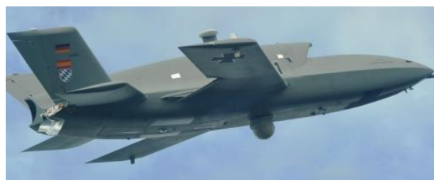
Рис. 9. БПЛА Barracuda

Європейським “Предейтором” повинен стати експериментальний тактичний ударний БПЛА німецько-іспанської розробки Barracuda, який має офіційну назву “Безпілотний літальний апарат в мережецентричному оточенні” (Agile UAV within Network-Centric Environments) (рис. 9).