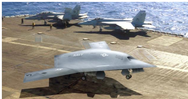
Рис. 7. БПЛА X-47В

Не слід також забувати про перспективні ударні палубні БПЛА військово-морських сил. За планами США перспективний розвідувально-ударний авіаційний комплекс в складі чотирьох – шести БПЛА повинен автономно діяти з авіаносця, перебуваючи у повітрі без дозаправки 11-14 годин, а також мати можливість здійснювати дозаправку у повітрі. Він повинен бути пристосований до дій в умовах сильної ППО. В концепцію бойового застосування БПЛА планується закласти архітектуру так званого “рою” (SWARM), який дозволить забезпечити спільне бойове застосування груп БПЛА з обміном розвідувальною інформацією та ударними діями. При цьому БПЛА повинен мати гіперзвукову швидкість (понад 5-6 М). І в США вже розроблені прототипи, такі як БПЛА X-47В (рис. 7), морські випробування якого сплановано розпочати в 2013 році.