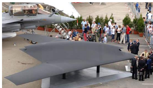
Рис. 8. БПЛА Нейрон

Так, першого грудня 2012 року на французькому випробувальному полігоні Істр був проведений перший політ демонстратора європейського ударного БПЛА Нейрон (рис. 8). Маса БПЛА Нейрон: суха – 5 т, максимальна злітна – 7 тонн. Корисне навантаження – 2 т (паливо та озброєння). Тривалість польоту близько 3-х годин, швидкість відповідає M=0,8 на висоті до 3000 метрів.