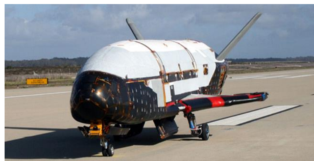
Рис. 13. БПЛА Х-37В

Рядом експертів Х-37В вже зараз розглядається не тільки як прототип майбутнього космічного перехоплювача, здатного за необхідності виводити з ладу супутники, але і як прототип засобу, здатного наносити ракетно-бомбові удари з орбіти, що повністю вписується в концепцію “швидкого глобального удару”.