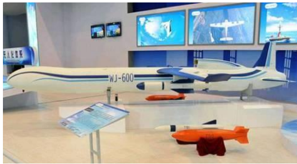
Рис. 10. БПЛА WJ-600

Наступним бойовим БПЛА, меншим за розмірами, є БПЛА Лонг (Птеродактиль). Розробляється також перспективний ударний БПЛА середньої дальності СН-3 з бойовим навантаженням до 640 кг (рис. 11).