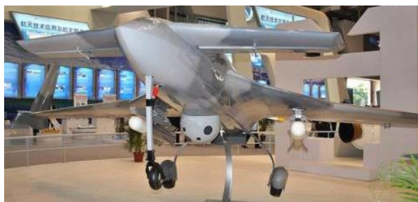
Рис. 11. БПЛА СН-3

Наступним бойовим БПЛА, меншим за розмірами, є БПЛА Лонг (Птеродактиль). Розробляється також перспективний ударний БПЛА середньої дальності СН-3 з бойовим навантаженням до 640 кг (рис. 11).