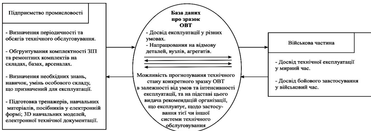
Рис. 2. База даних виробу промисловості