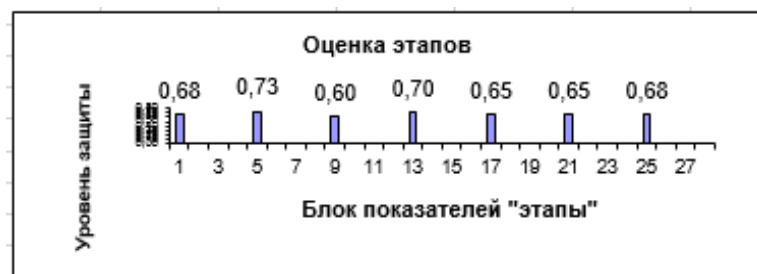
Рис. 7. Оценка качества выполнения этапов разработки и внедрения СЗИ

Анализ данной модели оценки рисков информационной безопасности показал, что модель, основанная на построении «Матрицы СУИБ», позволяет оценить важность и уязвимость ресурсов информационной системы. Преимуществом модели является полнота описания ИС, ее ресурсов и уязвимостей. Оценка рисков информационной безопасности позволяет выделить наиболее важные или уязвимые ресурсы, в результате чего, следует выбрать необходимые меры и средства по защите данных ресурсов. Также положительным является возможность оценки существующей системы защиты информации, и определение полноты мер и требований по обеспечению защиты информации.