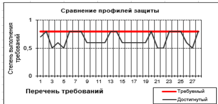
Рис. 6. Сравнение профилей защиты

защиты информации в сравнении с требуемым уровнем. Рис. 7 демонстрирует, насколько качественно и полно были выполнены все этапы по созданию СЗИ и какие этапы требуют усовершенствования (показатель «1» является выполнением требования на 100 %) [5].