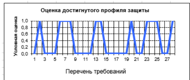
Рис. 5. Оценка достигнутого профиля защиты

Итогом заполнения данных полей таблицы являются графики (рис. 5 – 7), которые показывают степень выполнения мер защиты информации.