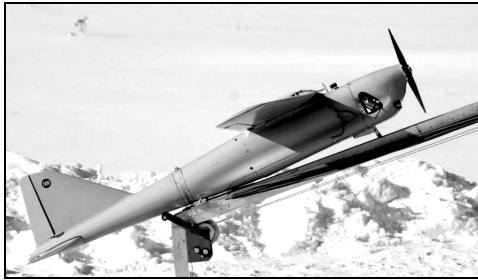
Рис. 3. Багатоцільовий БЛА «Орлан-10»

Комплекс «Орлан-10» складається з базової станції та декількох БЛА. Максимальна злітна маса БЛА за різними даними від 14 до 18 кг, з яких на корисне навантаження припадає 5 кг. Стартує з розбірної катапульты, здатний передавати відео на відстань до 120 км. Комплекс у складі стартової катапульты та 4 БЛА може перевозитися на автомобілі «УАЗ»-469 або «Рись» (італійський багатоцільовий броньований автомобіль Iveco LMV, що з кінця 2010 року збирається на КАМАЗ). Зовнішній вигляд комплексу наведений на рис. 3.