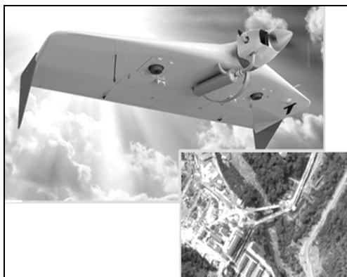
Рис. 1. Тактичний безпілотний авіаційний комплекс «ZALA 421-16»

зображень місцевості, визначає координати об'єктів спостереження, виконує функцію ретранслятора, здійснює збір, накопичення та обробку інформації. Основні тактико-технічні характеристики (ТТХ) комплексу «ZALA 421-16» наведені в табл. 1.