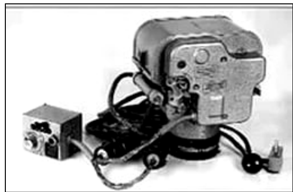
Рис. 1. Фотоапарат А-39 СМ

Аерофотоапарат А-39СМ – малогабаритний автоматичний, з дистанційним керуванням (рис. 1). Він призначений для ведення денної фоторозвідки і контролю результатів бомбометання його ТТХ представлені в табл. 1.