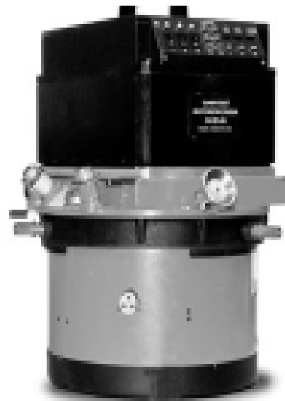
Рис. 3. Фотоапарат ЦКТ-140

ЦКТ-140 призначений для отримання цифрового зображення на принципі оптично-електричної посторогової реєстрації рушійної проекції земної поверхні, що формується об'єктивом на фокальній камері (рис. 3). При цьому розгортка уздовж напрямку польоту здійснюється за рахунок переміщення літального апарату. Живлення камери здійснюється від акумуляторного блоку, який забезпечує більше чотирьох годин автономної роботи. Можлива суміжна паралель живлення пристрою від акумулятора та мережі літального апарата. Наявність гіроплатформи дозволяє виконувати планову зйомку при виконанні протизенітного маневру, його ТТХ представлені в табл. 2.