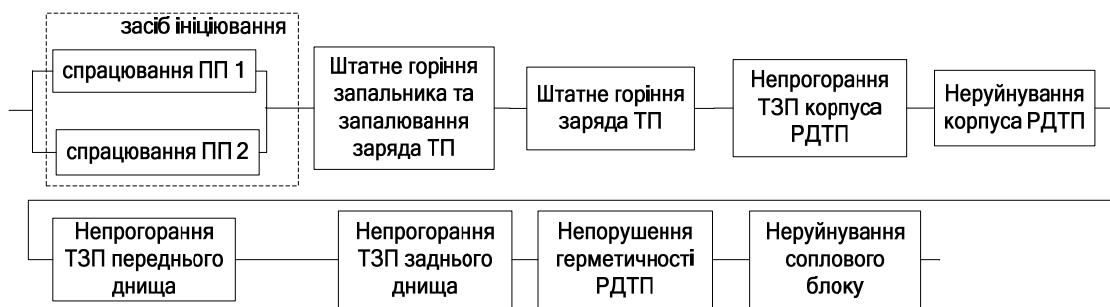
Рис. 4. СФСН РДТП для режимів пуску і польоту ЗКР

Відповідно до умови працездатності РДТП та послідовності спрацьовування його елементів СФСН РДТП при пуску і в польоті ЗКР можна представити у вигляді, наведеному на рис. 4.