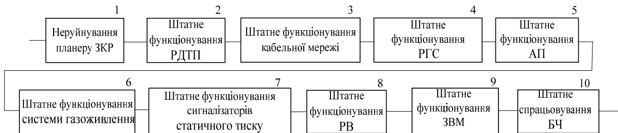
Рис. 2. СФСН ЗКР для режимів пуску і польоту

Для розробки СФСН ЗКР, її складових частин необхідно встановити поняття їх працездатного стану та відмови.