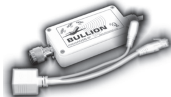
Рис. 3. Приймач ADS-B BULLION

Спеціалізовані радіоприймачі системи ADS-B комплектуються зовнішньою антеною, виконуються в герметичному корпусі, що дозволяє їх розміщувати на вулиці, та піднімати на щогли. Приймач виконує мінімальну обробку прийнятих сигналів. Вихідні дані видаються в коді AVR, та передаються за допомогою інтерфейсу Ethernet. Розміщення приймача біля антени виключає втрати сигналу в антенному кабелі. Допустима довжина кабелю до приймача складає 100 м, що дозволяє винести приймач на щоглу. Вартість такого приймача біля $200. Зовнішній вигляд одного з таких приймачів, виготовленого в Болгарії наведено на рис. 3.