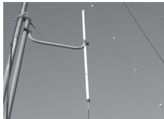
Рис. 7. Колінеарна антена для SDR приймача

В районі м. Харків проходив випробування SDR приймач. Для цього приймача була виготовлена колінеарна антена з коефіцієнтом підсилення біля 15 дБ. Довжина антенного кабелю складала біля 15 метрів. Антена була піднята на висоту біля 5 метрів (рис. 7).