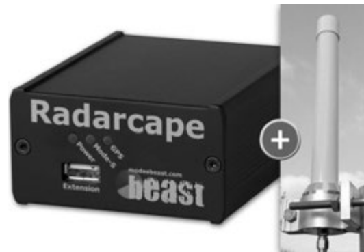
Рис. 2. Приймач ADS-B Radarcape

На рис. 2 показано приймач Radarcape вартістю 800 євро.