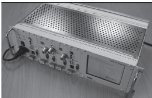
Рис. 1. Приймач ADS-B ELDIS

Професійні радіоприймачі системи ADS-B комплектуються штатними зовнішніми антенними пристроями і здійснюють повну обробку прийнятих сигналів системи ADS-B. Видача інформації користувачам здійснюється в протоколі ASTERIX, категорія 21 [3]. Вартість такого приймача складає декілька тисяч доларів США. Приклад такого приймача виготовлення фірми ELDIS (Чеська республіка) наведено на рис. 1.