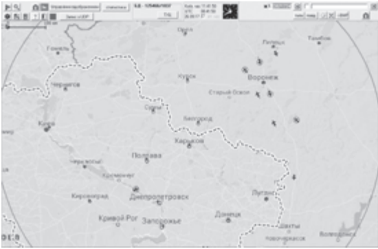
Рис. 8. Прийом даних ADS-B від SDR приймача

Під час проведення експериментів було започатковано створення бази даних адрес ICAO повітряних суден. Для кожної адреси у відповідність заносилася інформація про тип ПС, його реєстраційний номер та власника ПС. Для створення бази даних використовувалися відкриті Internet ресурси. На теперішній час в базі даних присутні більш 125 тисяч записів. Для використання даних ADS-B роботу по наповненню такої бази даних потрібно проводити постійно, тому що кожен місяць авіапромисловість випускає сотні нових ПС, які знаходять своїх власників. Також у світі досить розвинений ринок продажу так би мовити «вживаних» літаків. При перепродажі ПС іноді йому змінюють адресу ICAO і такий літак виглядає як новий. Іноді адресу літака не змінюють. Тоді в базі даних потрібно редагувати власника ПС.