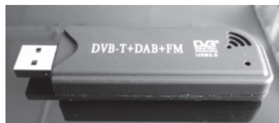
Рис. 4. SDR приймач ADS-B

Сканери частотного радіодіапазону призначені для використання приватними користувачами, більшість з яких виготовляється у Китаї і представляють собою компактні USB-пристрої. Такі прилади ще називаються SDR приймачами (Software defined radio – програмно визначаєма радіосистема). Вигляд такого пристрою наведено на рис. 4.