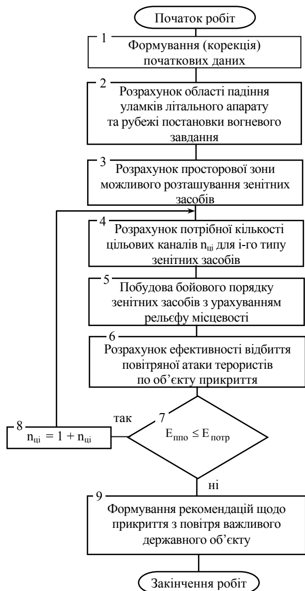
Рис. 3. Методика побудови бойового порядку зенітних засобів при прикритті з повітря ВНО

Початкова інформація вибирається з підготовлених баз даних, які формуються заздалегідь або в процесі підготовки рішення і нанесення на електронну карту загальної обстановки (блок 1).