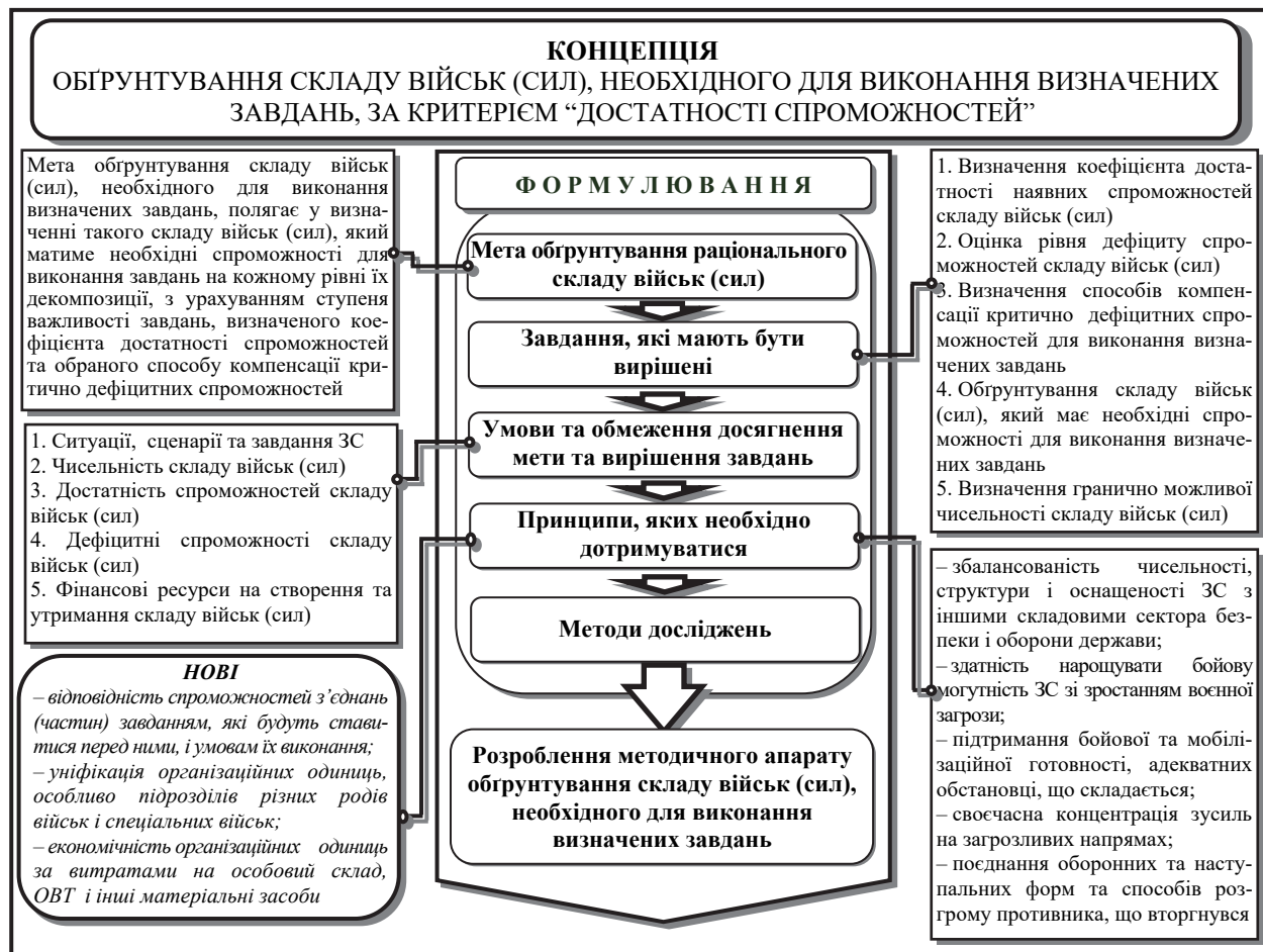
Рис. 1. Загальний зміст концепції обґрунтування складу військ (сил), необхідного для виконання визначених завдань, за критерієм “достатності спроможностей”

Дотримання цього принципу дозволить мати склад військ (сил), що за своїми спроможностями забезпечить виконання завдань та буде сприяти ефективному використанню сил і засобів.