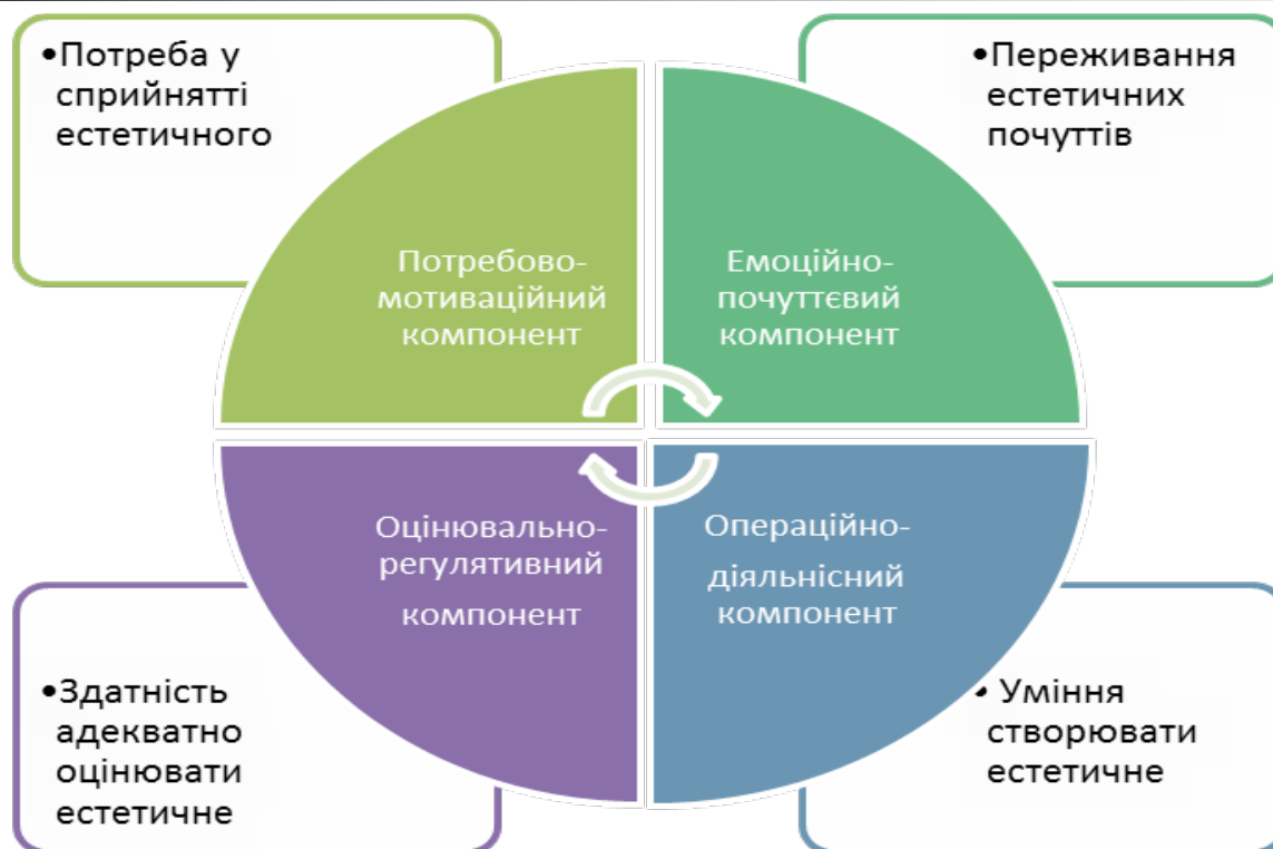
Рис. 1. Теоретична модель структури естетичної обдарованості дошкільника

Розроблено методику діагностики естетичної обдарованості дітей старшого дошкільного віку, проведено її обговорення, апробацію та корекцію, вироблено рекомендації для діагностичної роботи психологів та вчителів. Методика діагностики містить наступні етапи та методи: