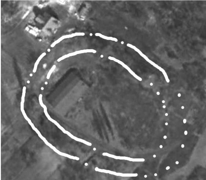
Кільцева структура виявлена в районі ДОТ № 179

них документів було знайдено матеріали стосовно поховання більше, ніж трьохсот бійців Червоної армії на території Києва. Пошук в інших архівах, Київському міському архіві та у базі військових поховань Київського спецкомбінату не дав результату. Проте на допомогу прийшли архівні німецькі аерофотознімки військового часу. Порівнюючи аерофотознімки території, що була зазначена в радянських архівних документах як місце поховання