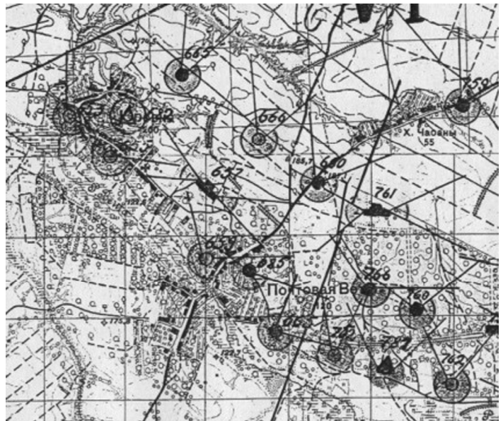
Батальйонний район оборони № 6 (1937 р.)