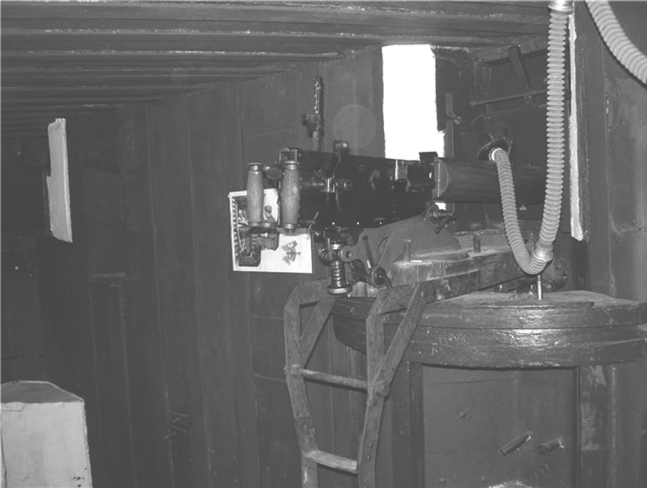
ДОТ № 180 – музейний комплекс «Пояс Слави – Київський Укріплений Район» Київського міського історико-патріотичного клубу «Пошук».

1200 бійців Червоної армії. Разом із працівниками Міністерства надзвичайних ситуацій України знескоджено більше 2000 мін і снарядів минулої війни. Оpubліковано низку книжок, присвячених обороні Києва. Волонтери Клубу надають допомогу ветеранам, шефствують над шкільними музеями. В межах міжнародної співпраці пошукові загони Клубу постійно беруть участь у «Вахтах Пам'яті» на території Росії та Білорусії [9].