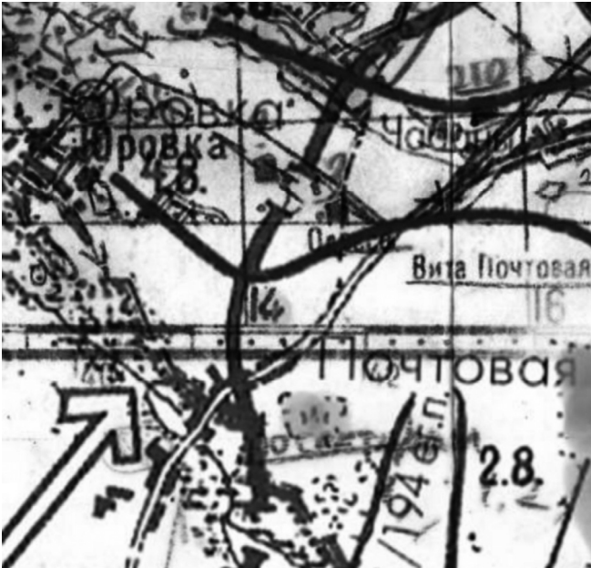
Фрагмент оперативної Карти оборони радянських військ у серпні 1941 р.

Пошукова Робота з застосуванням нових методів дослідження.