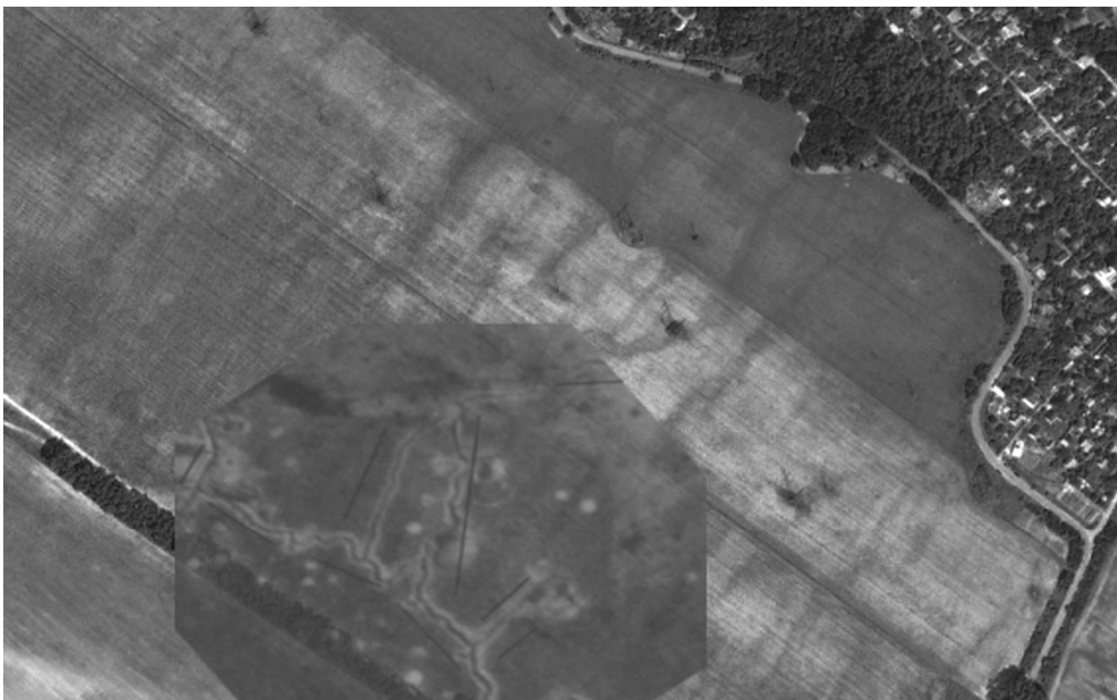
Результат накладання аерофотознімку воєнного часу на сучасний космоснімок