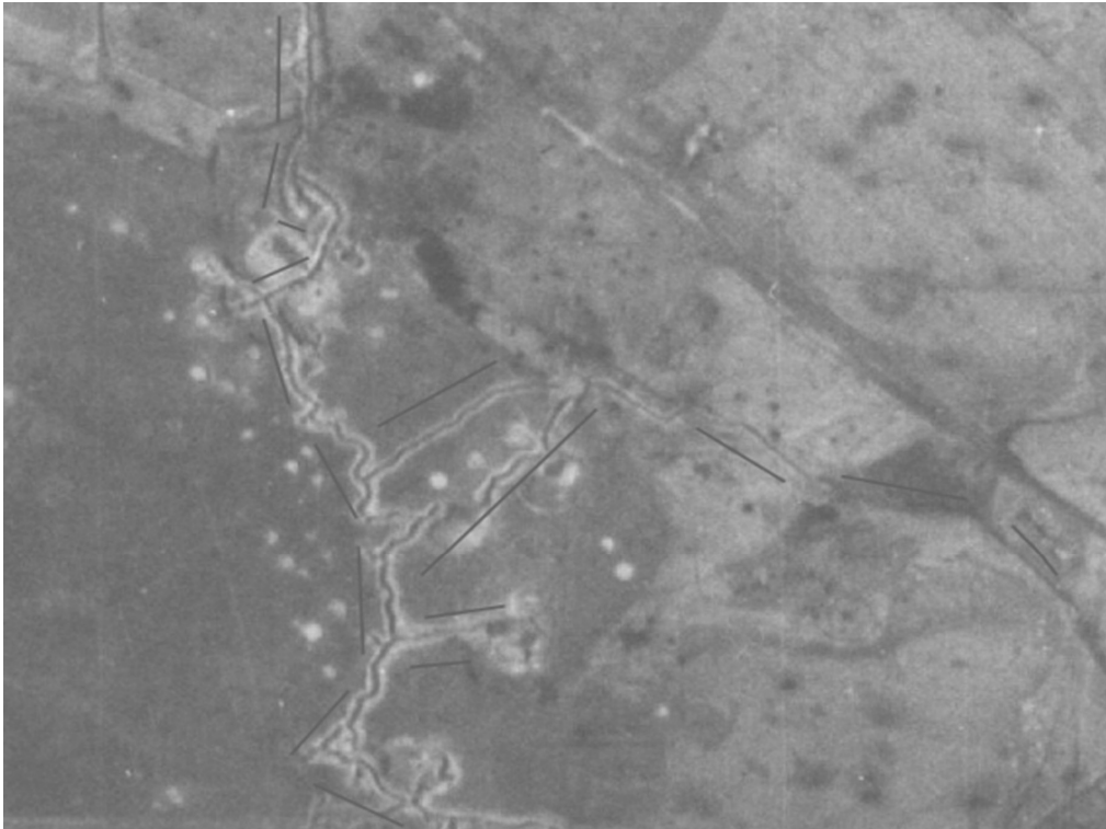
Фрагмент німецького аерофотознімку радянської лінії оборони район с. Віта-Поштова