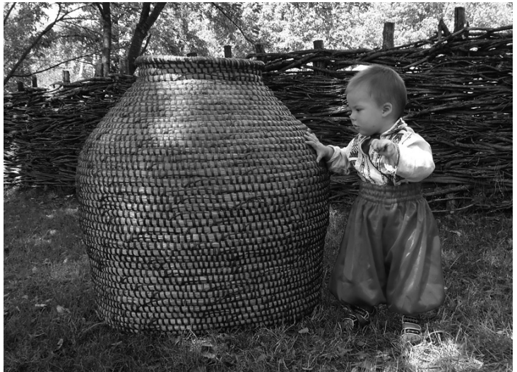
Солом'яник; с. Євминки, Козелецький район, Чернігівська обл. (інв. № Е-431)