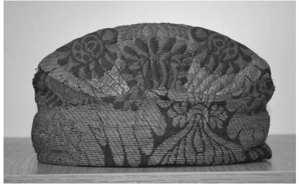
Очіпок; с. Жадове, Семенівський район, Чернігівська обл. (інв. № Т-1048)

Останнє за досліджуваний період відрядження в Чернігівську обл. здійснив 11–13