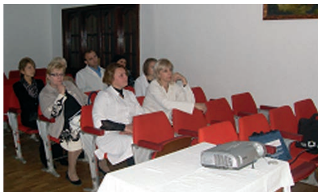
Симуляційний тренінг в обласній дитячій лікарні м.Тернопіль (2012 р.)

Наукова робота кафедри впродовж багатьох років спрямована на педіатрію розвитку, вивчення норм психо-фізичного, репродуктивного та біологічного розвитку дітей, особливості формування кісткової та серцево-судинної систем у дитячому віці. Результатом досліджень є запропонована скринінго-валеологічна методологія всебічної оцінки розвитку дітей, продовжується робота над формуванням нормативної бази соматометричних та психометричних показників дітей різного віку у Буковинському регіоні.