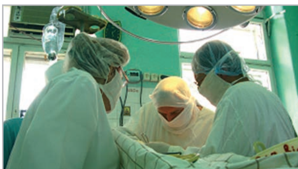
Робочі будні лікарні

Не менш складним, що потребує значної уваги, є розділ консультативної роботи у міських пологових будинках. Консультативна допомога надається у відділеннях неонатального догляду та відділеннях інтенсивної терапії новонароджених. За роки роботи суттєва увага приділялася удосконаленню лікувально-діагностичних мож-