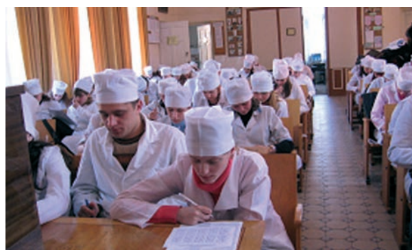
На лекції з пропедевтики педіатрії

У 2004 році кафедра залучилася до англійського навчання студентів, а з 2007-2008 навчального року – приєдналася до викладання дисциплін за вимогами Болонського процесу.