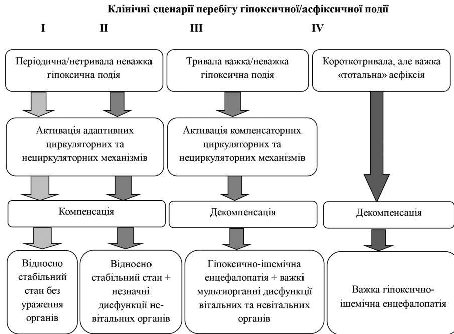
Рис 2. Клінічні сценарії стану новонародженого після гіпоксичної події

зультати власних досліджень, ми припускаємо, що після гіпоксичної події на анте-інтранатальному етапах, динаміка стану дитини після народження може відбуватись за 4-ма клінічними сценаріями (рис.2). Перший клінічний сценарій, коли стан дитини відносно стабільний без ознак дисфункції невітальних органів, що свідчить про неважку нетривалу гіпоксичну подію, при якій циркуляторні механізми адаптації скомпенсували і не викликали ураження органів.