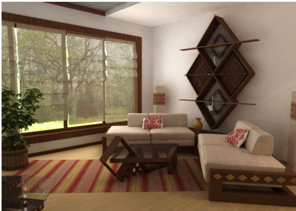
Рис.3. Дизайн сучасного інтер'єру в межах довільної планувальної схеми з врахуванням національних рис (Південь)

3) максимально застосовано натуральні матеріали або їх імітація, щоб наблизити простір до традиційного українського інтер'єру і зробити типові форми більш впізнаваними, поєднавши їх разом з відповідними фактурами;