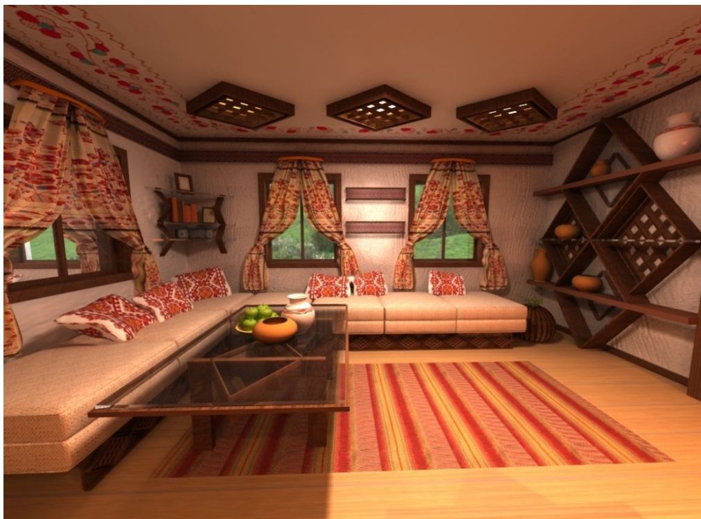
Рис.2. Дизайн сучасного інтер'єру в межах традиційного плану з врахуванням національних рис (Південь)