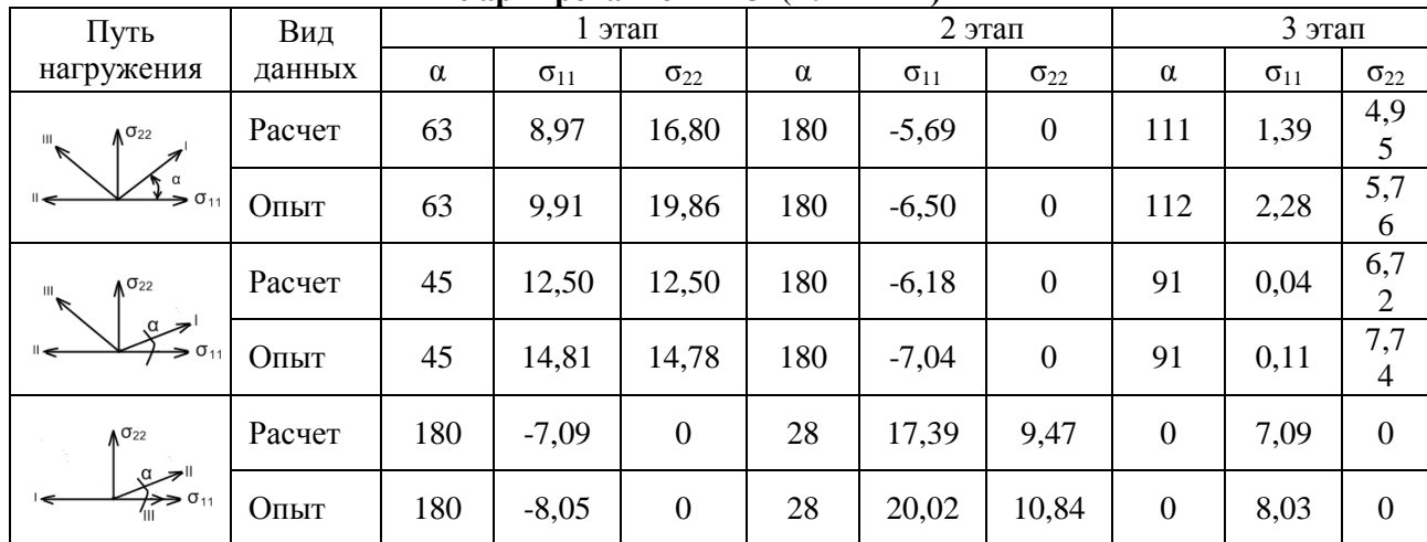
Сравнение расчетных и опытных значений напряжений для волокнистых композитов с армированием \pm 45^\circ (10-1МПа)

Из таблицы 1 следует, что максимальное отклонение расчетных значений от опытных составляет 18%.