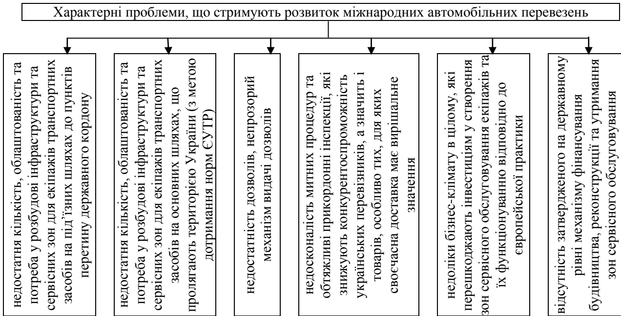
Рис. 2 Характерні проблеми, що стримують розвиток міжнародних перевезень автомобільним транспортом

З метою поліпшення становища та інтеграції національної мережі міжнародних транспортних коридорів до Європейської транспортної системи доцільно здійснити ряд заходів, впровадження яких дозволить прискорити адаптацію транспортної системи України до Європейської спільноти: