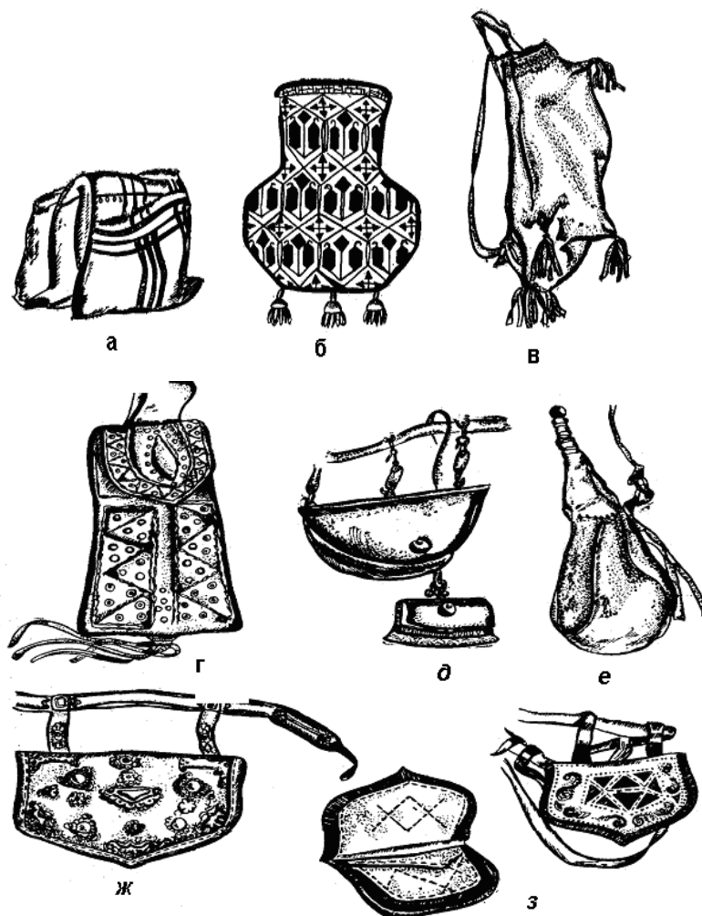
Рис.4. Сумки народів Середньої Азії

Воїни та мисливці носили пояси, до яких підвішували зброю, кресало, а також і маленьку декоративну плоску сумку з клапаном, який був прикрашений срібними накладками. Жінки носили хейкен – шкіряна сумка для ключів і мільких грошей.