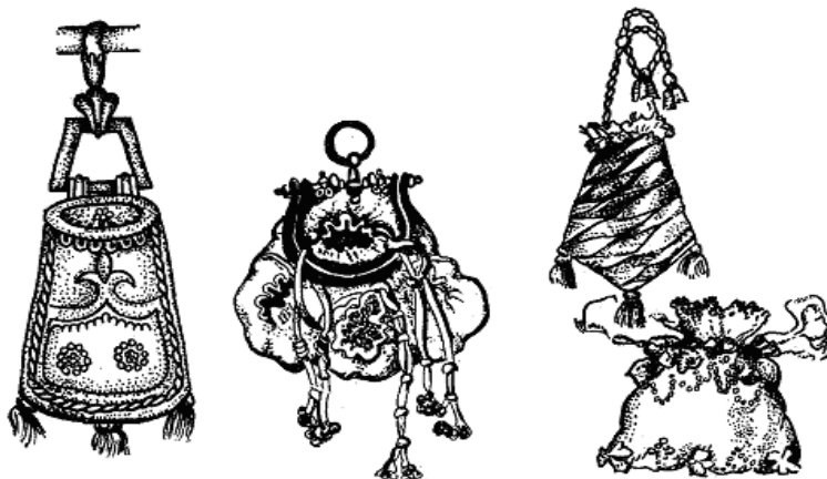
Рис.2. Сумки XVI – XVIII століть