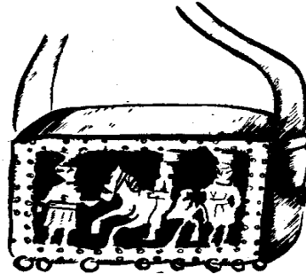
Рис.3. Сумка для коновала

Особливу сумку мали коновали: невелика, із жорсткої шкіри, прямокутної форми і простими клинчиками (рис.3).