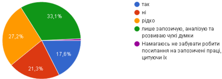
Рис. 2. Діаграма розподілу відповідей респондентів на запитання «Чи використовуєте Ви чужі праці для написання своїх (без посилання на автора)»

Цікавим є, що для написання своїх робіт, у тій чи іншій мірі використовуються чужі доробки без посилання на авторство чи джерело: від 86% студентів молодших курсів (16-18 років) до 79% студентів старших курсів (19-21 рік). При цьому цей же показник для вікового показника 22-60 років складає 91%. А більша половина респондентів (69,9%) вважає допустимим використання в своїх роботах запозичення чужих праць без посилань на автора або джерело, в тому числі залежно від виду робіт (рис.3).