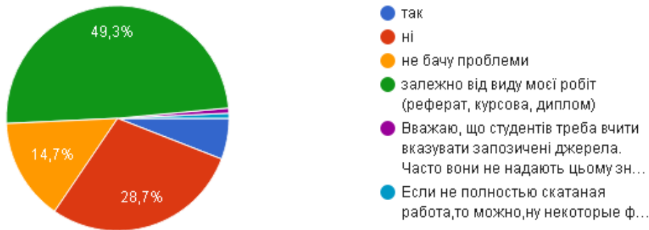
Рис. 3. Діаграма розподілу відповідей респондентів на запитання «Чи вважаєте Ви допустимим використання в своїх роботах запозичених праць без посилань на автора або джерело?»

Цікавим є, що для написання своїх робіт, у тій чи іншій мірі використовуються чужі доробки без посилання на авторство чи джерело: від 86% студентів молодших курсів (16-18 років) до 79% студентів старших курсів (19-21 рік). При цьому цей же показник для вікового показника 22-60 років складає 91%. А більша половина респондентів (69,9%) вважає допустимим використання в своїх роботах запозичення чужих праць без посилань на автора або джерело, в тому числі залежно від виду робіт (рис.3).