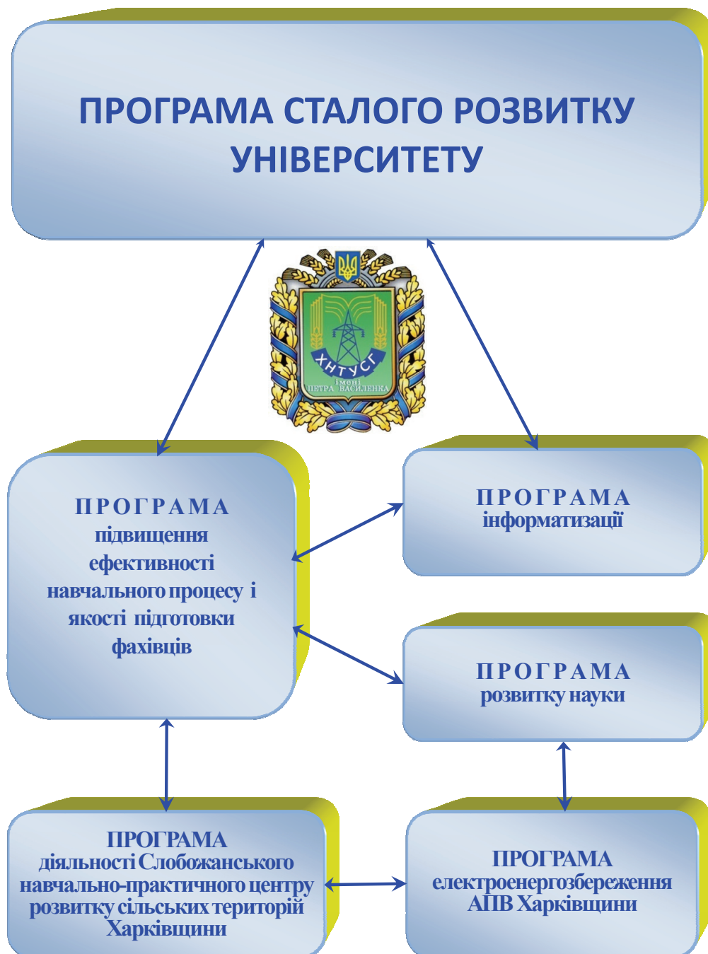
Рис. 4. Інноваційні програми сталого розвитку ХНТУСГ

фінансово-економічного забезпечення; робітничих професій; практик і працевлаштування; виставково-музейний; системи менеджменту якості; організаційно-адміністративний; дистанційного навчання; Слобожанський навчально-практичний центр; правничо-кадровий; ефективності господарювання; спілка випускників; земляцтва студентів; просвітницька рада.