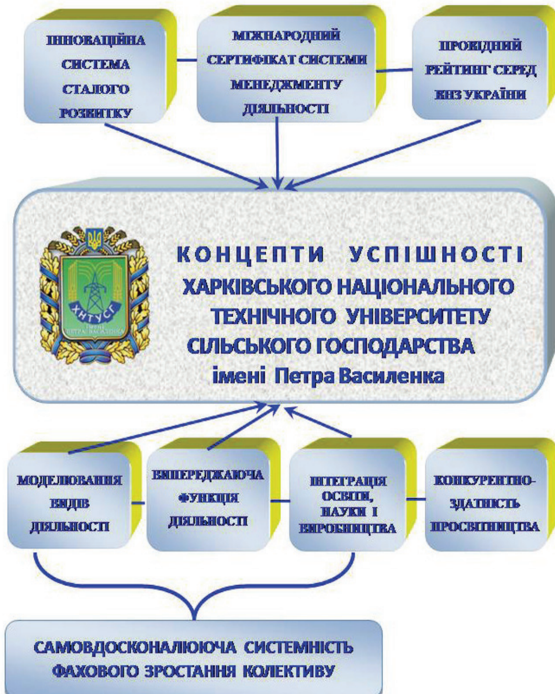
Рис. 1. Визначені концепти успішності колективу

рейтингом ТОП-200 61-66 місце; серед 229 ВНЗ за рейтингом МОН — 6 місце, серед аграрних ВНЗ — 3; 2, а в 2014 р. за консолідованим рейтингом ТОП-200, Scopus, Webometrics — серед 17 аграрних ВНЗ Міністерства агрополітики — 1 місце, серед 32 харківських ВНЗ — 11 місце.