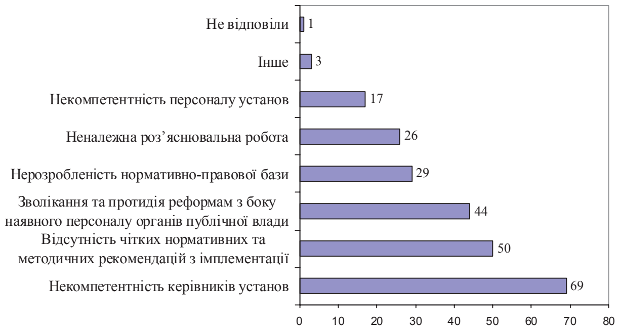
Рис. 3. Розподіл відповідей респондентів на запитання: «Що може бути загрозою успішному реформуванню державної служби України?» (у % до всіх опитаних; сума відповідей перевищує 100 %, тому що можна було обирати декілька варіантів відповіді)

— не лише цивілізованим методом вирішення соціальних конфліктів, а в першу