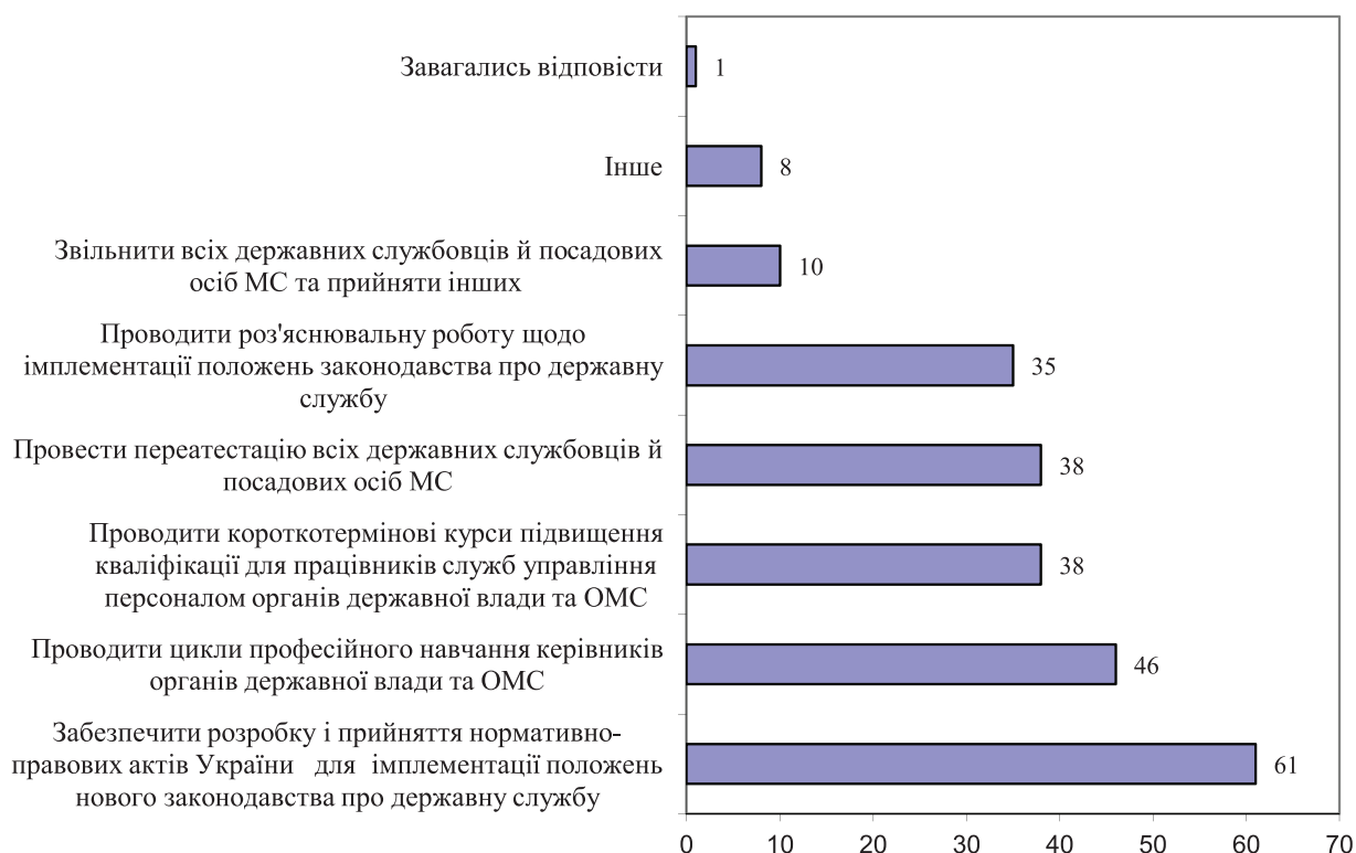
Рис. 2. Розподіл відповідей респондентів на запитання: «Що, на Вашу думку, необхідно вжити задля успішного реформування державної служби в сучасних умовах?» (у % до всіх опитаних; сума відповідей перевищує 100 %, тому що можна було обрати декілька варіантів відповіді)

— проведення сучасних науково-комунікативних заходів. Цікавим прикладом цього може стати вже традиційна щорічна науково-освітня виставка «Публічне управління XXI», основною метою якої є презентація досягнень, сучасних розробок та можливостей освітньої галузі «Публічне управління та адміністрування», налагодження конструктивної взаємодії з надавачами суспільних послуг, бізнес-середовищем, сприяння формуванню й реалізації інноваційних наукових і освітніх проектів, поглиблення міжнародної