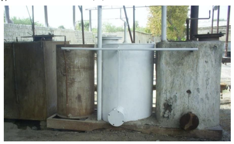
Рис. 3 – Общий вид опытно-производственной биогазовой установки

Нагревание биореактора и, следовательно, сбраживаемого субстрата осуществляется через герметичную водяную нагревательную систему, содержащий теплообменник (7), водяной насос (8) и обволакивающие реактор трубчатые теплообменники (14).