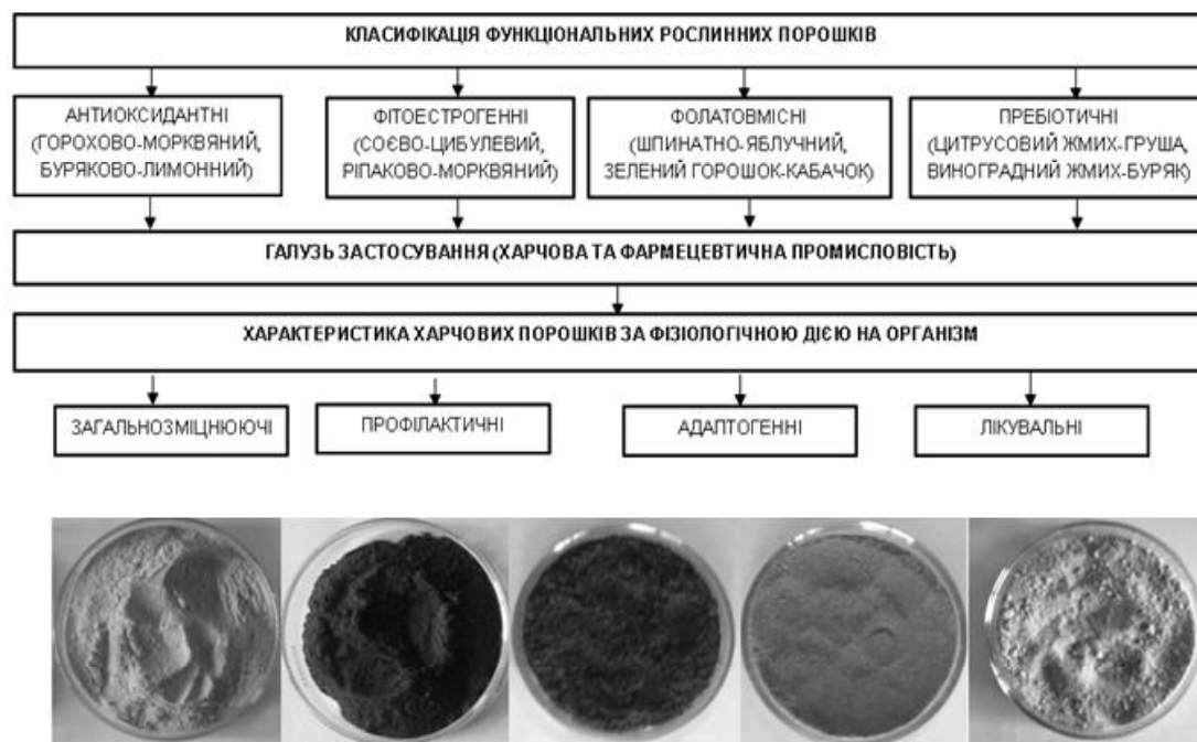
Горохово-морквяний Буряково-лимонний Ріпаково-морквяний Шпинатно-яблучний Яблучно-кабачковий

Наведена класифікація розроблених функціональних порошоків, які розділені на 4 функціональні групи (рис. 2).