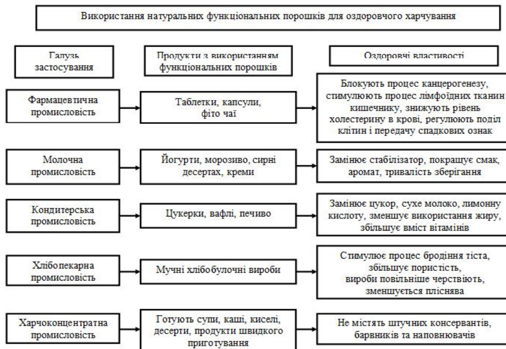
Рис. 3 – Використання натуральних функціональних порошків

Продукти функціонального харчування містять харчові мікронутрієнти. Тому функціональні порошки можна використовувати для оздоровчого харчування (рис. 3). Порошки використовуються як добавки до харчових продуктів, а також для створення продуктів швидкого приготування на їх основі.