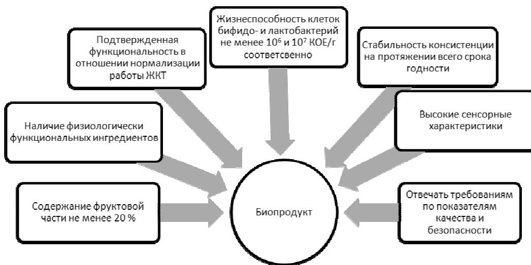
Рис. 2 – Требования к биоферментированным продуктам

Разработка рецептурных композиций проводилась на основе комплексного подхода, были выделены основные компоненты и параметры, характеризующие их качественные показатели.