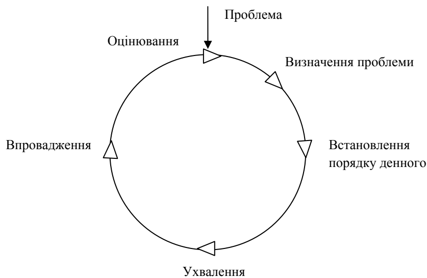
Рис. 1. Механізм формування державної політики [21, с. 23]

В цілому механізм формування державної політики згідно цієї концепції можна представити, як зображено на рис. 1. [21, с. 23].