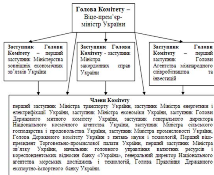
Рис. 1. Склад Міжвідомчого комітету України у справах Європейських Співтовариств (станом на 1993 р.) 1

Указом Президента України від 7 лютого 1995 р. «Про заходи щодо вдосконалення співробітництва України з Європейським Союзом» [5] змінено Указ Президента України від 28 серпня 1993 р. «Про Міжвідомчий комітет України у справах Європейських Співтовариств». А 21 квітня 1997 р. був виданий Указ Президента України «Про заходи щодо вдосконалення механізму взаємодії з Європейським Союзом та його виконавчими органами» [6], який змінив два попередні зазначені документи, удосконалив та посилив інституційну основу європейської інтеграції України. Даний Указ було прийнято з метою реалізації проголошеного стратегічного курсу на інтеграцію до Європейських Співтовариств та належного організаційного забезпечення імплементації Угоди між Україною та Європейськими Співтовариствами про партнерство і співробітництво та положень Плану дій Європейського Союзу стосовно України.