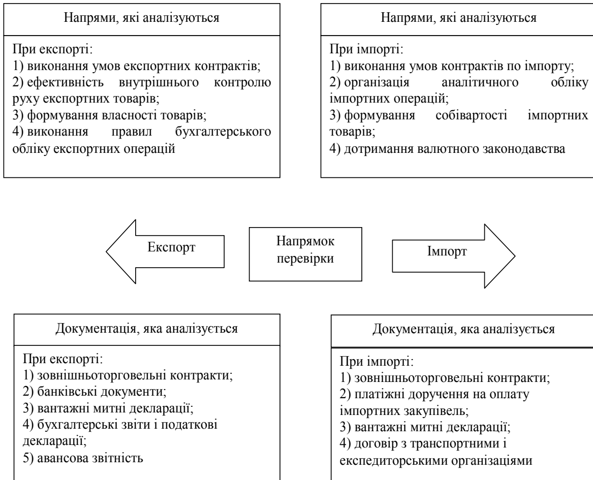
Рис. 2. Напрями перевірки, яка здійснюється аудиторами в рамках завдання митного органу з виявлення фінансових та інших порушень при проведенні контролю на засадах митного постаудиту

Результатом роботи має стати експертний висновок, звіт, рекомендації або інший документ, який надається керівнику ревізійної комісії для включення в акт або робочу документацію за результатами перевірочних заходів. Крім того, залучення таких фахівців доцільно також і при проведенні роботи, пов'язаної з аналізом фінансово-господарської діяльності учасників ЗЕД. Дана діяльність може бути спрямована на перевірку якісного стану майна, ефективність використання капіталу та інших питань, безпосередньо пов'язаних з фінансово-господарською діяльністю.