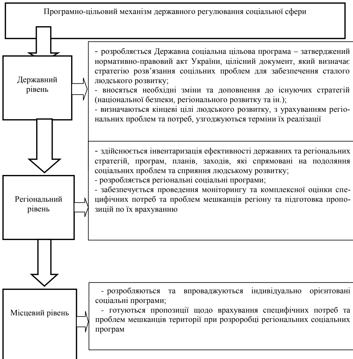
Рис. 1. Зміст програмно-цільового механізму залежно від рівня та повноважень суб'єктів державного регулювання соціальної сфери

Зміст програмно-цільового механізму залежно від рівня та повноважень суб'єктів державного регулювання у соціальній сфері представлено на рис. 1. Кожен з рівнів: державний, регіональний місцевий має свої завдання, функції та повноваження.