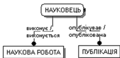
Рис. 6. ER-діаграма. Науково-дослідна діяльність кафедри. Рівень сутностей.

Отже у процесі надання освітніх послуг кафедрою і визначення їхньої якості, беруть участь такі інформаційні об'єкти та їхні властивості (рис. 7) [13, 14]: