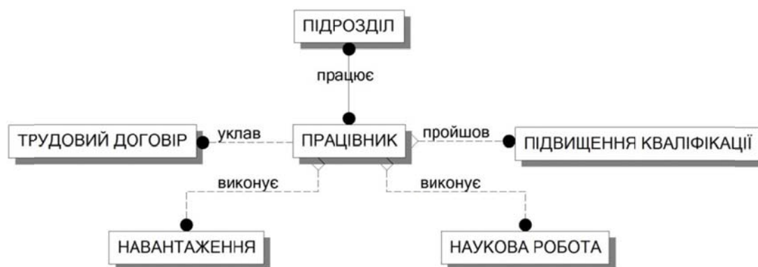
Рис. 2. ER-діаграма бази даних «Кадрова діяльність кафедри»

Першим етапом проектування концептуальної моделі інформаційної системи є визначення сутностей предметної області та зв'язків між ними. Розглянемо описання лише тих інформаційних об'єктів, що беруть участь у процесах розв'язання задачі визначення якості надання освітніх послуг. Проектована підсистема визначення якості надання освітніх послуг кафедрою має забезпечувати розв'язування таких задач: контроль наявності навчально-методичних матеріалів дисциплін у розрізі спеціальностей; комплексний контроль якості знань студента; оцінювання студентами та роботодавцями освітньої послуги; формування різноманітних аналітичних звітів; формування пропозицій щодо планування навчального процесу (навчальні плани, робочі програми тощо).