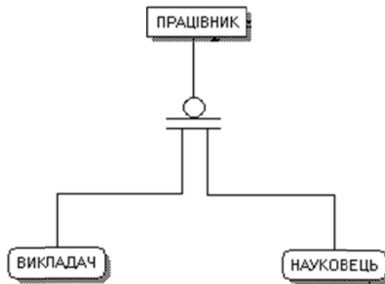
Рис. 4. ER-діаграма. Працівник і його підтипи. Рівень сутностей.