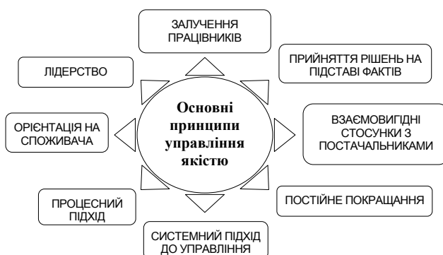
Рис. 1. Принципи управління якістю у сфері вищої освіти

Особливу увагу треба приділити принципам управління якістю у сфері вищої освіти (рис. 1).