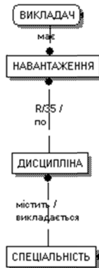
Рис. 5. ER-діаграма. Викладацька діяльність кафедри. Рівень сутностей