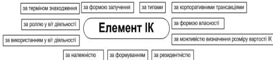
Рис. 2. Класифікаційні ознаки елементів інтелектуального капіталу підприємства

формування методик оцінювання ІК та вирішення різнопланових завдань управління ІК.