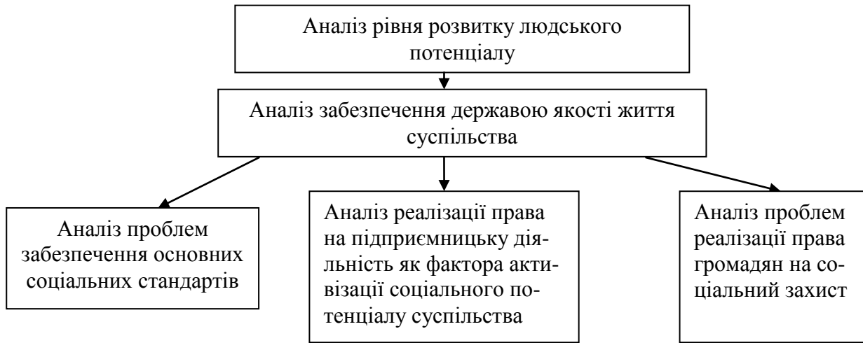
Рис. 1. Етапи визначення сучасних особливостей та характерних рис розвитку соціального потенціалу

Виклад основного матеріалу дослідження. Автор вважає за доцільне виявити особливості та характерні риси розвитку соціального потенціалу на основі його аналізу за наступною схемою.