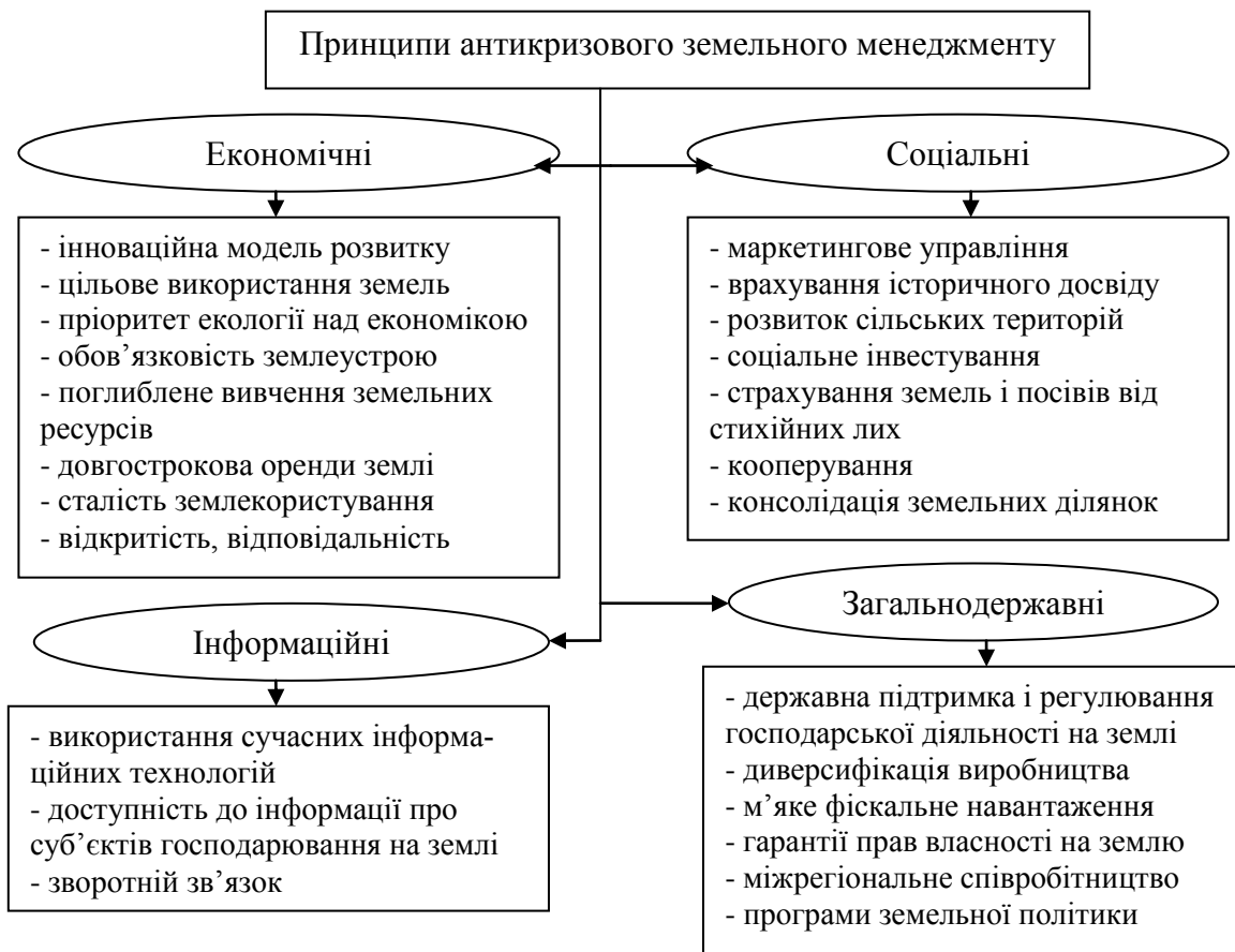
Рис. 3. Принципи антикризового земельного менеджменту *