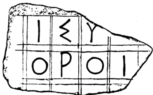
Мал. 1. Фрагмент IOSPE I 2 307

Група присвятних лапідарних написів (NO 55, NO 56, NO 57, NO 58, NO 167), знайдених на теменосі у середині минулого століття, підтвердила існування в Ольвії у V ст. до н. е. колегії мольпів, аналогічно материнському полісу Мілету. Інтерпретація цих пам'ятників у цілому завершена публікаціями П.О. Каришковського [1], Ю.Г. Виноградова [2] та А.С. Русяєвої [3]. Однак, багато питань, пов'язаних з датуванням цих написів, а також виникненням, функціонуванням та ліквідацією колегії мольпів в Ольвії, дискусійні, що визначає актуальність теми [4].