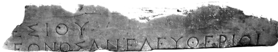
Мал. 10. Присвята IOSPE I 2 160 – ймовірний пам’ятник тираноборцю з роду Пантаклів-Клеомбротів

(IOSPE I 2 160) (мал. 10) його сином, Гікесієм Гекатеоновим, присвячена Зевсу Елевтерію.