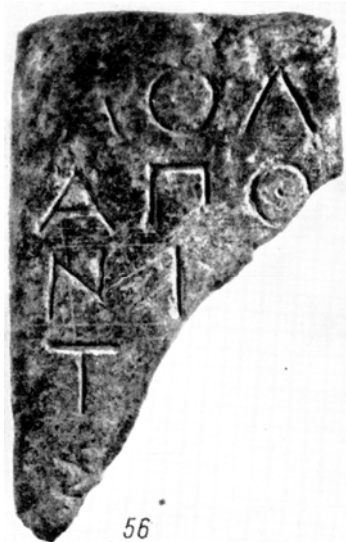
Мал. 7. Фрагмент НО 56

При описі, зокрема, пам'ятника НО 59 (умовно віднесеного до написів мольпів) видавці відзначають схожість шрифту й орфографії з декретом НО 2. У свою чергу, видавці датують декрет НО 2 кінцем V ст. до н. е.