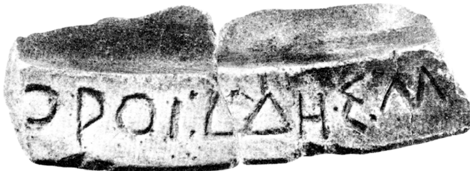
Мал. 4. Збіжні по зламах фрагменти А і Б мармурового блюда НО 63