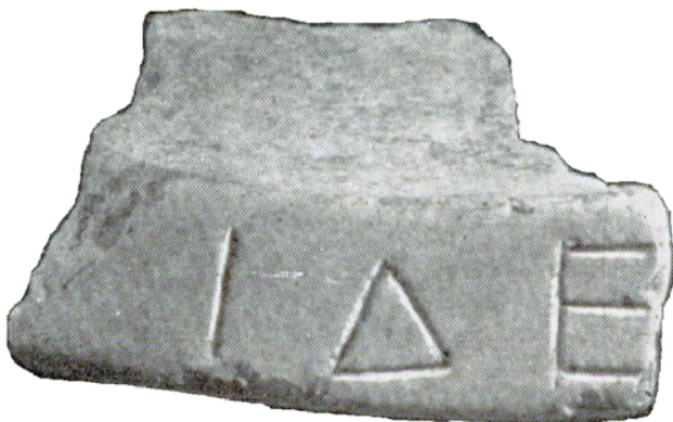
Мал. 5. Фрагмент мармурового блюда НО 60 із присвятою Аполлону Дельфінію

Запропоную один з можливих варіантів інтерпретації непрофесійного виконання напису мольпів на мармуровім блюді НО 63. Отже, враховуючи нечисленність знахідок жертвних блюд, вважаю за можливе поставити завдання про перевірку приналежності фрагментів НО 63 (мал. 4) і НО 60 (мал. 5) одному блюді. (Напис НО 60 датується видавцями другою половиною V ст. до н. е.).