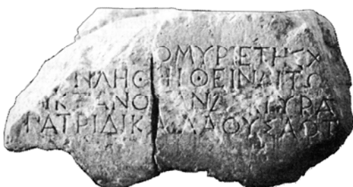
Мал. 9. Присвята тираноборцю з роду Леократидів-Євресибіадів

Дослідники звернули увагу на те, що така важлива історична подія для Ольвії, як остаточна перемога демократії, не знайшла відображення в жодному декреті [66]. Імовірно причиною відсутності декретів є те, що фактично відбулися події, які були лише епізодом боротьби кланів, щось подібне до двірського перевороту, коли від влади був усунутий тиран, але оточення його залишилося, що й привело до деяких демократичних змін у державному устрої. Події ж, пов'язані з поваленням тиранії в Ольвії, очевидно, були увічнені встановленням статуй. Тираноборцю з роду Леократидів-Євресибіадів була встановлена статуя (мал. 9), текст на постаменті якої відновлений Ю.Г. Виноградовим [67].