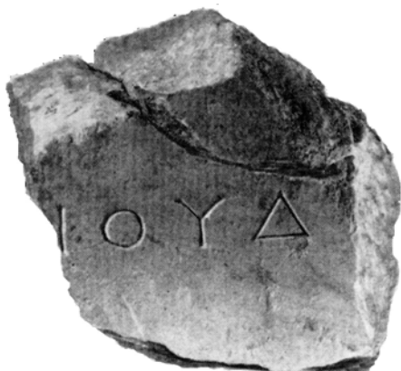
Мал. 11. Присвята HO 66 – ймовірний пам’ятник тираноборцю з роду Діонісіїв

фрагментом бази такого пам’ятника може бути камінь HO 66 (мал. 11), який містить початкові літери імені Діонісій, характерного родового імені роду Діонісіїв.