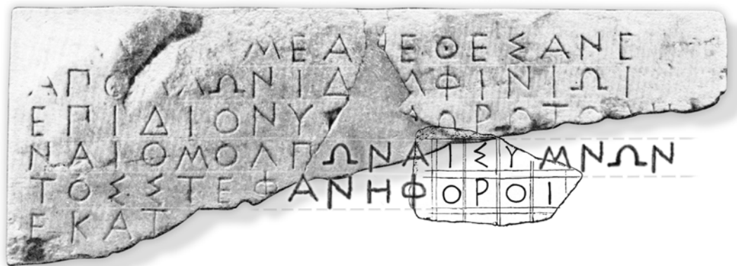
Мал. 2. Возз'єднання фрагментованих написів HO 58 та IOSPE I 2 307

в манері стойхедон, синхронне їхнє датування видавцями. Фрагментований напис IOSPE I 2 307 був, імовірно, віднесений П.О. Каришковським [5] до написів ольвійських мольпів. Фрагмент IOSPE I 2 307 з'єднується в контакт з фрагментом HO 58 по своєму верхньому краю, який проходить по внутрішній розмічальній лінії першого рядка (мал. 2).