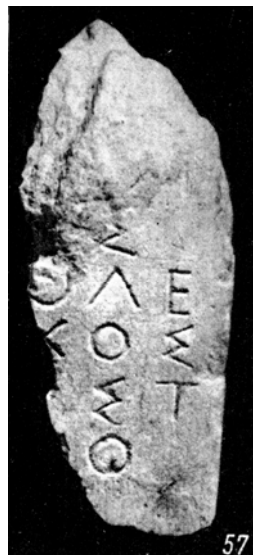
Мал. 8. Фрагмент НО 57

Серйозне протиріччя породжує грубе виконання написів мольпів НО 63 і НО 167, що зовсім не узгоджується як зі статусом цієї колегії, так і з загальним уявленням про мольпів. Відмічу, що до групи грубо виконаних написів відноситься й фрагмент НО 64, однак відсутні докази приналежності цього пам'ятника мольпам. До речі, видавцем пам'ятник НО 64 віднесений до рубежу V-IV ст. до н. е., тобто синхронно пропонованого мною датування грубо виконаних написів НО 63 і НО 167. Ю.Г. Виноградов [43], переконливо інтерпретуючи напис НО 64 як присвяту Зевсу й Афіні, за трьома неохайно виконаними літерами і наявністю трикрапкової інтерпункції (яка, як відомо [44], застосовувалася протягом усього V ст. до н. е.), удревняє на сто років цей пам'ятник, відносячи його до рубежу VI-V ст. до н. е.