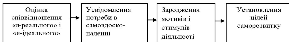
Рис. 2. Процес становлення мотиваційних чинників студента

Показниками ефективності мотиваційних настанов до самоосвітньої діяльності студентів-економістів виступають: усвідомлення соціальної значущості власної професії; виявлення ініціативи у діагностуванні власних навчальних потреб та формулювання навчальних цілей; розуміння необхідності постійного особистісного зростання. Усе це стає можливим за умови включення студента-економіста в розвиваюче середовище, де він зможе співставити власні життєві прагнення з вимогами майбутньої професії задля розуміння і відчуття потреби в професійному зростанні через самостійно організовану діяльність. Даний процес становлення визнання необхідності саморозвитку розробляється В. Ковальовим [5], відображений на схемі на рис. 2: