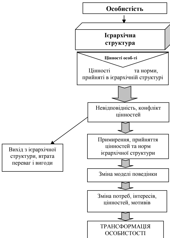
Рис. 2. Механізм трансформації особистості в ієрархічній структурі.

Таким чином, роблячи висновок, можна зауважити, що професійна діяльність накладає на особистість значний відбиток, який може нести як позитивне, так і негативне навантаження. Професійна діяльність в умовах ієрархічної структури значно підвищує ступінь та трансформуючи характер впливу, а оскільки досить велика кількість організацій та установ функціонують за ієрархічним принципом (особливо в політико-владній сфері), то необхідність дослідження даної проблеми та вироблення рекомендацій з приводу зміни ситуації на краще є необхідною умовою розвитку суспільства.