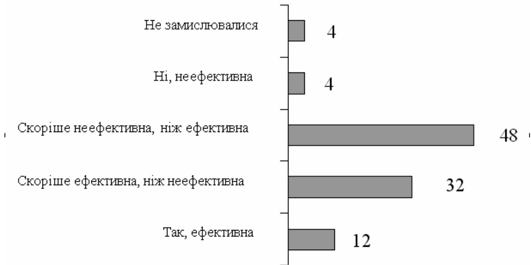
Рис. 1. Ступінь ефективності соціально-гуманітарної освіти як фактора демократизації суспільства в сучасній Україні (%)

(48 %). 32 % опитаних вважають, що ця система скоріше ефективна, ніж неефективна, 12 % – що вона ефективна, і лише 4 % – неефективна.