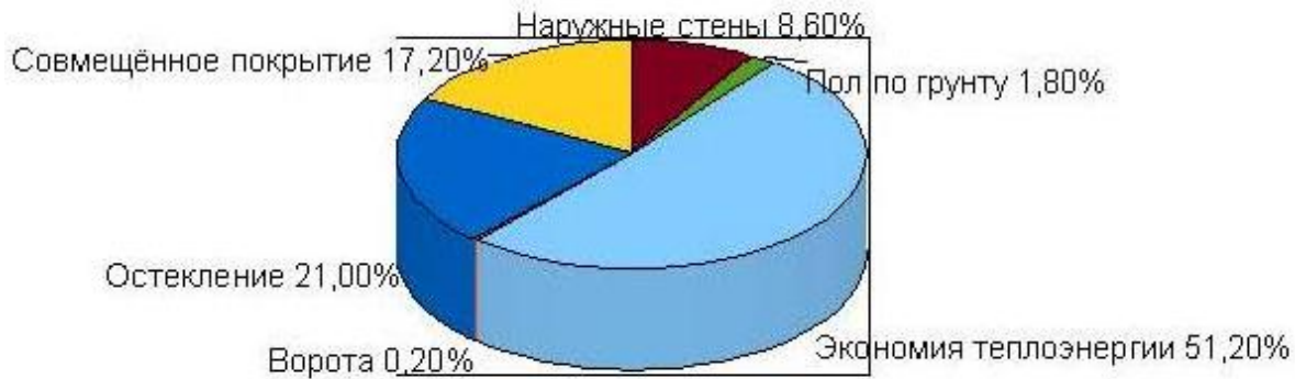
Рисунок 3. Долевое распределение нормируемых теплопотерь через наружные ограждающие конструкции здания

Обеспечить значительное сокращение затрат на отопление, вентиляцию и горячее водоснабжение участка упаковки возможно только при комплексном подходе. Последний предусматривает наряду с повышением энергоэффективности ограждающих конструкций здания использовать один из вариантов автономного теплоснабжения участка в т.ч. административно-бытовых помещений.