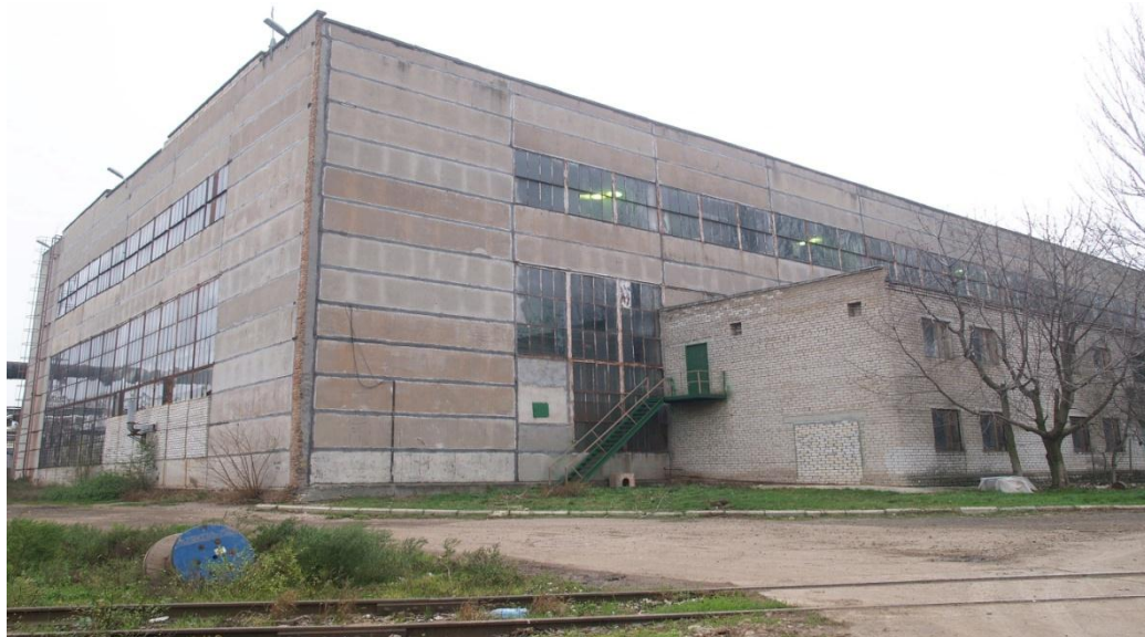
Рисунок 1. Внешний вид здания участка упаковки

Приведённый коэффициент теплопередачи наружных ограждающих конструкций здания превышает нормативную (максимально допустимую) величину более чем в 2 раза.