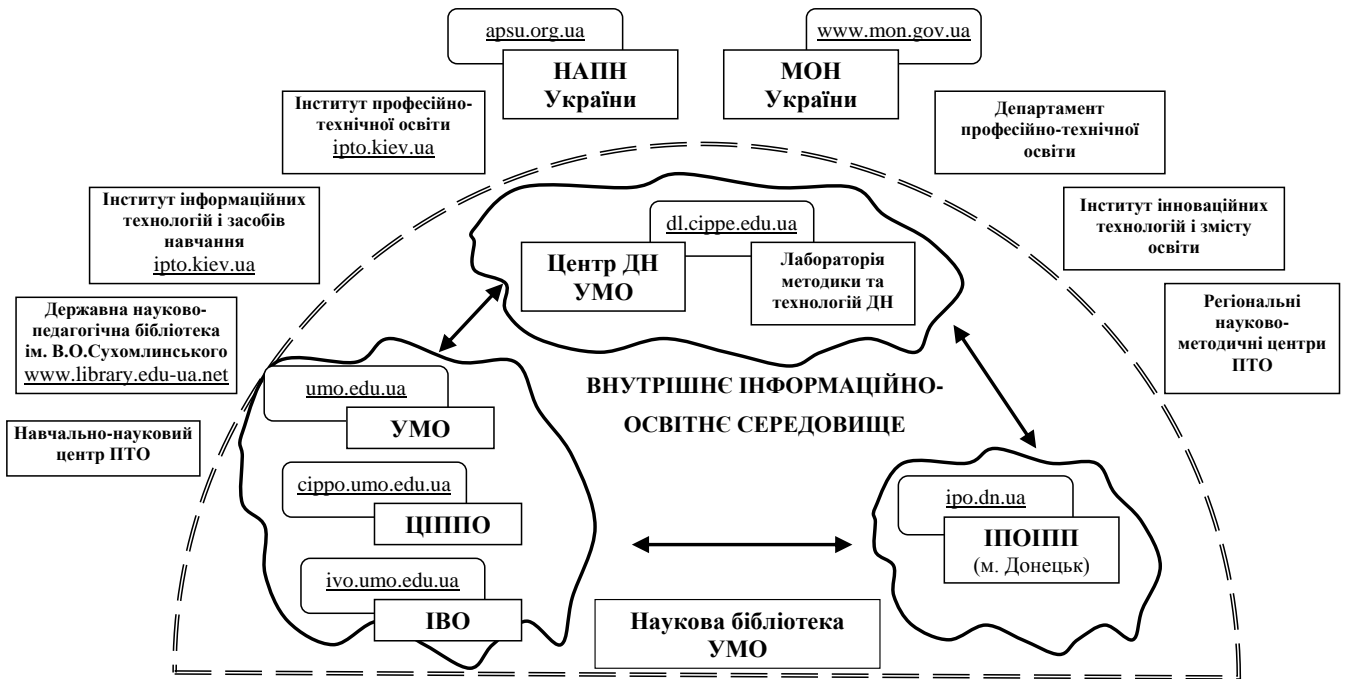
Рис. 4. Структура інформаційно-освітнього середовища системи підвищення кваліфікації керівних і педагогічних працівників освіти