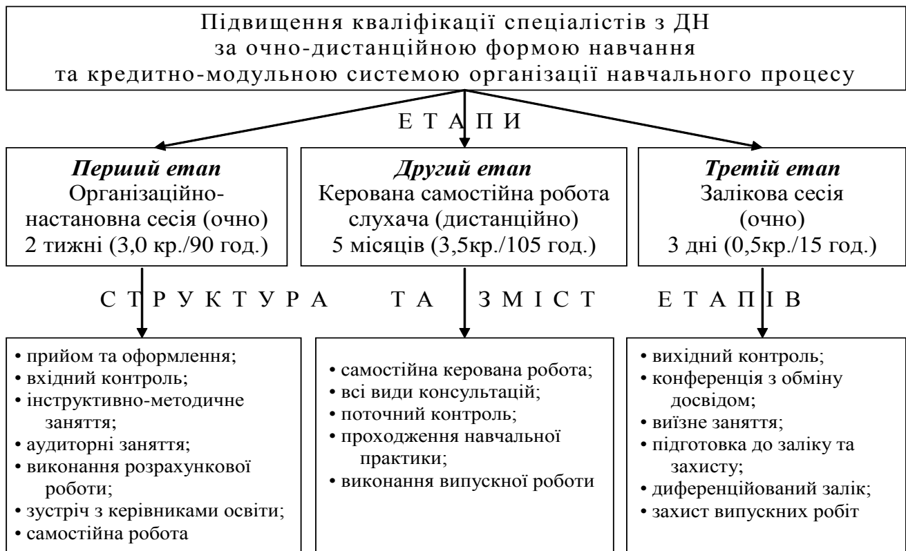
Рис. 2. Структура очно-дистанційного підвищення кваліфікації спеціалістів із ДН

Для якісного планування та організації підготовки фахівців у сфері ДН було розроблено комплекти навчальної документації, що відповідає вимогам ECTS, а саме [3]: