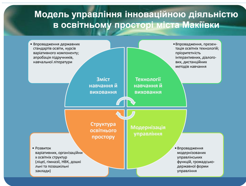
Рис. 1. Модель управління інноваційною діяльністю в освітньому просторі

Ми впроваджуємо дієву модель управління інноваційним середовищем освітнього простору, що відповідає завданням Програми розвитку освіти міста (2012-2016) і забезпечує ефективність та результативність методичної взаємодії (рис. 1). Керівництво інноваційними процесами відображено на рисунку 2.