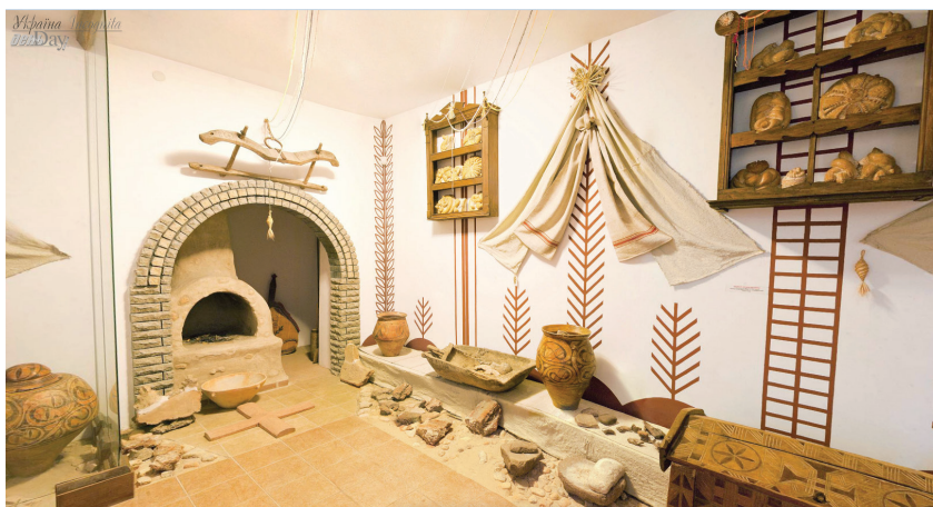
Рис. 1. Музей трипільської культури

Так, на уроках українознавства у 5-му класі під час вивчення теми «Мій український народ» учитель за допомогою комп'ютера та інтерактивної дошки може звернутися до Музею трипільської культури « Стародавня Арата – Україна » ( http://incognita.day.kiev.ua/museums/trypillia/ ), де можна ознайомитися з однією із найдавніших землеробських культур, що існувала на теренах сучасної України.