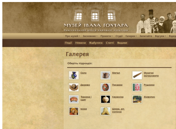
Рис. 3. Музей Івана Гончара