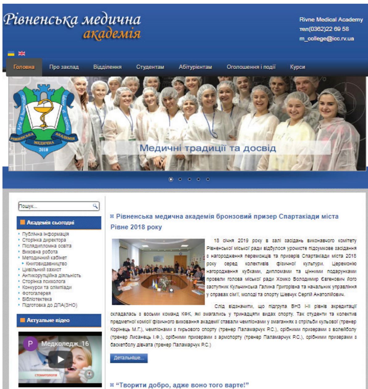
Рис. 3. Головна сторінка веб-сайту Рівненської медичної академії

Нині кожен ЗВО, який розраховує на збільшення кількості абітурієнтів, має власний веб-ресурс та використовує його для реклами власного потенціалу та освітніх можливостей із метою залучення майбутніх студентів і створення позитивного іміджу закладу.