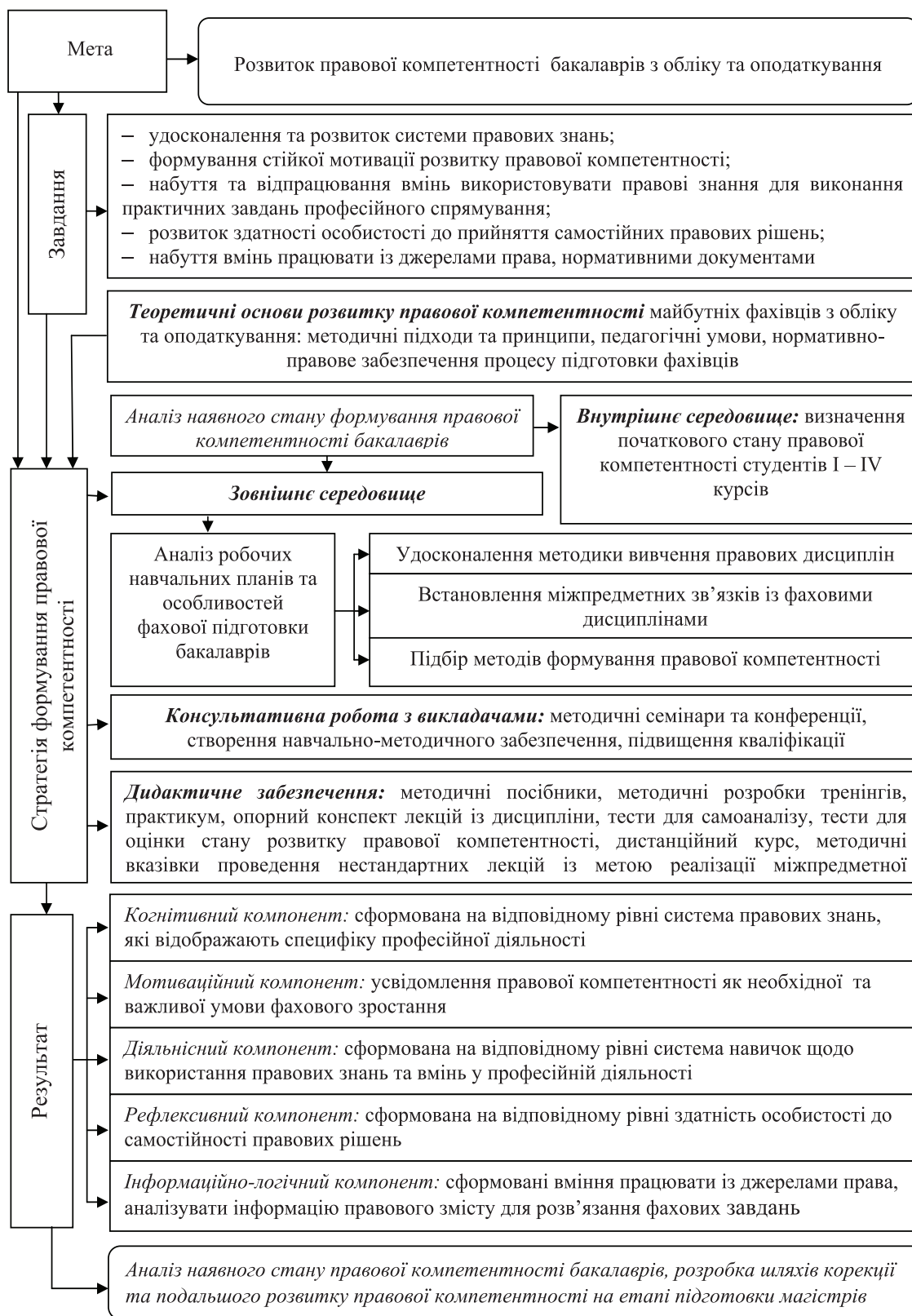
Рис. 1. Структурно-змістова система формування правової компетентності бакалаврів з обліку та оподаткування

У процесі формування правової компетентності майбутніх бакалаврів з обліку та оподаткування були використані різні типи міжпредметних зв'язків: фактичні – між навчальними предметами на рівні фактів; понятійні – спрямовані на формування понять, загальних для спорідне-