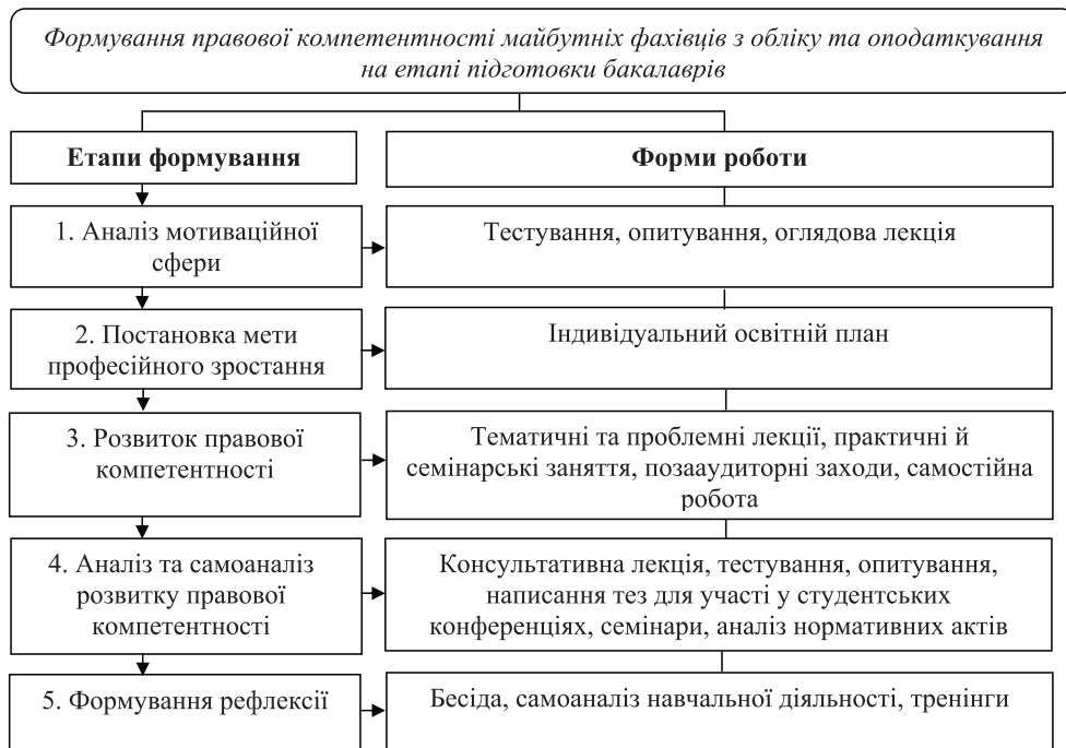
Рис. 2. Формування правової компетентності бакалаврів з обліку та оподаткування

Ураховуючи вимоги особистісно орієнтованого методологічного підходу, процес формування правової компетентності бакалаврів з обліку та оподаткування