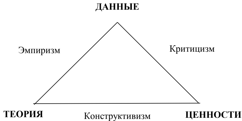
Рис. 2. Интегральная концепция социальных наук Гальтунга

гральной схеме социальных наук Дж. Гальтунга (См. рис. 2).