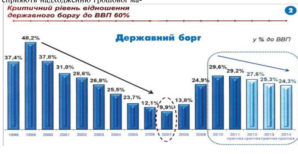
Рис. 2. Динаміка державного боргу України відносно ВВП за 1998-2014

си в країну, як результат – збільшення надходжень до бюджету. Проте, в порівнянні з 2012 р. за даними Держкомстату в Україні зафіксовано скорочення експорту товарів на рівні 9,1%, тому така перспектива для нашої країни є малоюмовірною. Разом з тим, якщо державний борг зростає в умовах припинення зростання ВВП або його падіння, то наслідки для країни-боржника можуть бути більш негативними. Накопичення боргів з року в рік в кінцевому результаті може привести країну до боргової кабали, втрати економічної незалежності у світовому співтоваристві [4].