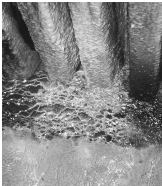
Рис. 4. потужна кірка на балках стін (нагадує плетений кошик) дамби та їх скупчення на дні гірничої виробки (ДШС 27 bis)

Мінеральні новоутворення важкорозчинних солей на балках стелини та верхній частині стояків.