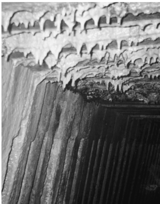
Рис. 1. гребінці карбонатів на балках стелини (ДШС №27 bis, випуск Голованя, 15 м від К-8)

марганцю, заліза, магнію та кварцом — 1%. Білі перли (ДШС №-27 bis) не містять кварцу, а ізоморфні домішки марганцю, заліза, магнію складають в них біля 8,75%.