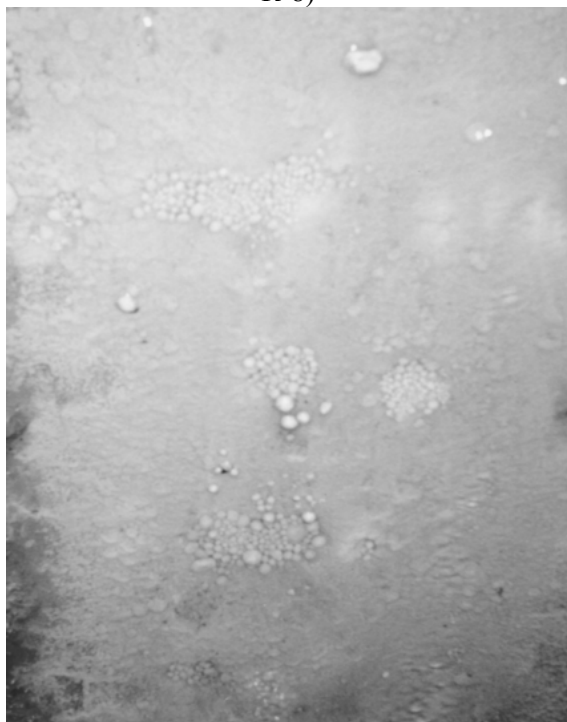
Рис. 3. карбонатні пізоліти, що утворилися в субаквальних умовах на дні виробки ДШС №27