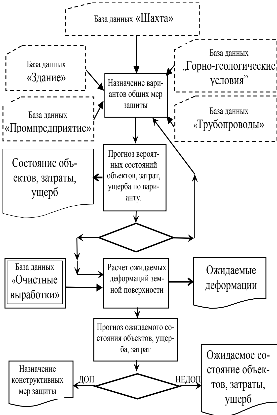
Рис. 1. Принципиальная схема назначения общих мер защиты