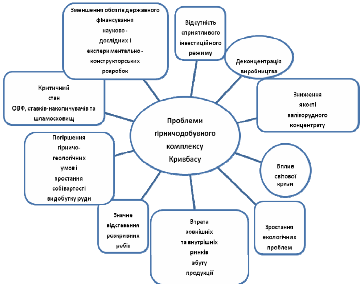
Рис. 1. Головні проблеми та специфічні умови функціонування залізородної галузі Криворізького басейну

вони зазвичай працюють автономно і координація їх дій на регіональному рівні відбувається, в кращому випадку, через місцеві органи влади. В умовах ринкових відносин, неконкурентна здатність суб'єктів виробництва визначає успішний їх розвитку це закономірно, але всіх цих суб'єктів в масштабі регіону об'єднують екологічні, економічні і соціальні проблеми, які неможливо вирішити на якомусь локальному рівні обмеженому комбінатом, комплексом, концерном, заводом, тощо. Це питання, які стосуються регіону загалом і самих суб'єктів виробництва в даному регіоні зокрема. Для оперативного вирішення таких регіональних проблем потрібні відповідні інституції, основна задача яких повинна зводитись до узагальнення, аналізу екологічних, економічних і соціальних питань регіону з подальшою розробкою рекомендацій їх розв'язання на користь суб'єктів виробництва і регіону загалом.