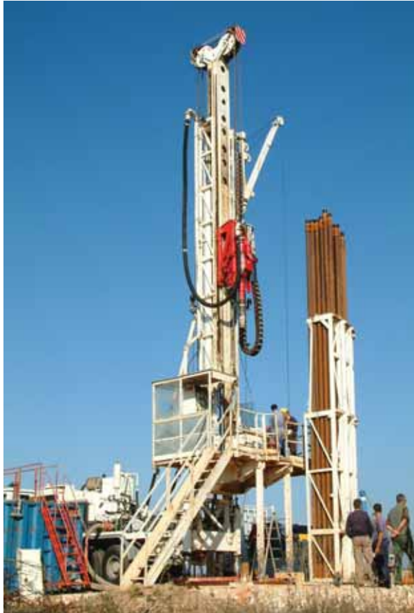
Рис.1. Буровая установка G-75.

Сложность внедрения технологии бурения на пене в условиях Донецкого бассейна заключается в том, что осадочный комплекс по всему региону неоднороден, сложный по горно-геологическому строению, имеет большое количество водоносных и поглощающих горизонтов, тектонических нарушений и неустойчивых пород, склонных к обводнению и обрушению стенок скважины. Поэтому на первоначальном этапе были проведены работы по предварительной проработке технологии бурения с пеной на Южно-Донбасском участке Марьинского района Донецкой области на глубинах до 400 м. В качестве дисперсной фазы использовался сжатый воздух от винтового компрессора «Ingersoll Rand» производительностью 25,5 м 3 /мин и давлением до 25 кг/см 2 . В качестве дисперсионной среды техническая вода с рН≥7, пенообразователь - сульфенол российского производства и в качестве стабилизатора -КМЦ -500. Работы проводились на скважинах № 3Э и № 4Э: