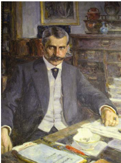
Рис. 1. Профессор Новороссийского университета, археолог Э. Р. фон Штерн. Портрет кисти К. Костанди

В последнее время специальное предметное изучение истории археологических исследований приобретает в нашей науке (в том числе и в антиковедении) все более широкое распространение. Создаются фундаментальные аналитические работы как по истории археологии в целом [см. например: 1, 2], так и по истории изучения отдельных археологических памятников, регионов, культур или периодов [см. например: 3, 4, 5], а также по истории развития археологии в конкретных городах или научных центрах, музеях, университетах [6, 7, 8, 9, 10, 11]. В этом отношении следует сказать, что еще далеко не все подобные темы подняты и раскрыты, не все памятники и археологические центры имеют свою написанную и опубликованную историю исследования, а имена целого ряда ученых-археологов, в силу различных обстоятельств, остаются либо полузабытыми, либо же их вклад в развитие отечественной науки раскрыт еще недостаточно полно и объективно.