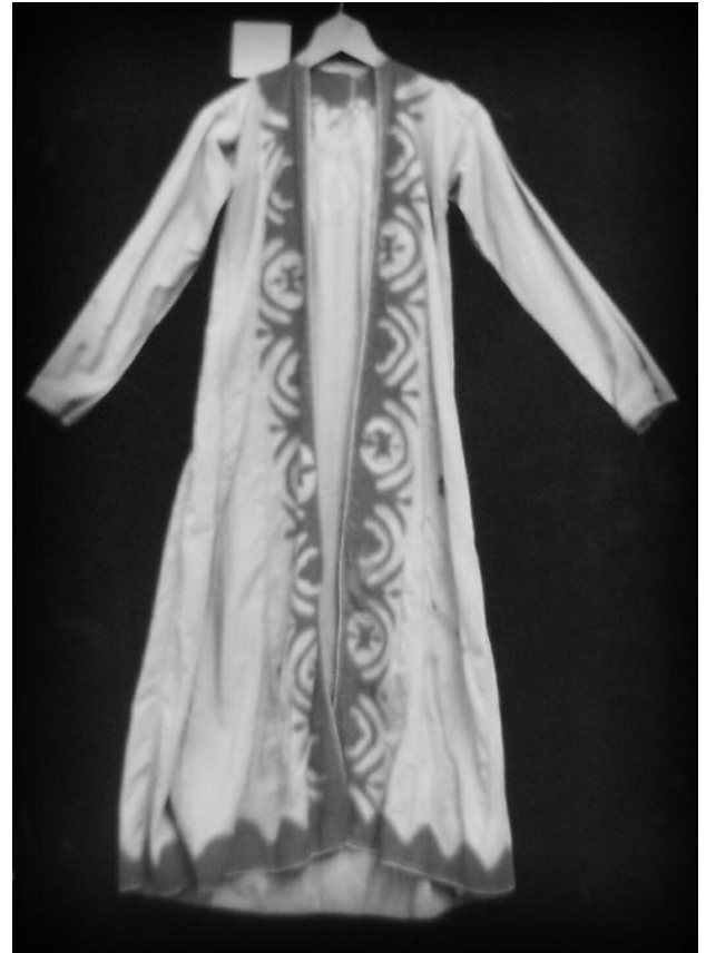
Рис. 7. Верхнее халатообразное наплечное покрывало «фередже». Крымские татары, д. Ай-Серез, XIX в. / Фото. Фонды КРУ БИКЗ. Т-189.