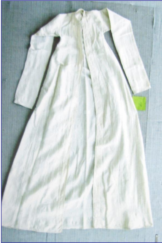
Рис. 6. Верхнее халатообразное наголовное покрывало «фередже». Крымские татары, д. Ай-Серез, XIX в. / Фото. Фонды КРУ БИКЗ. Т-188.