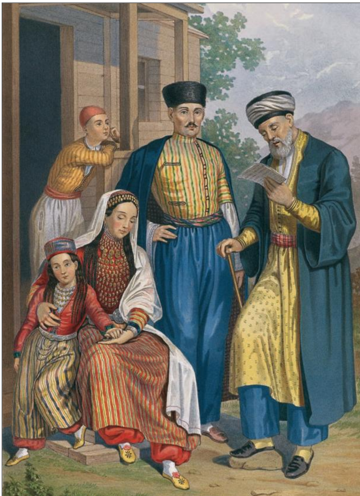
Рис. 5. Верхнее халатообразное головное покрывало «фередже». Крымские татары. 1840-50-е гг. / «Крымские татары. Мулла» / Г.-Т. Паули. Этнографическое описание народов России. – С.-Пб., 1862.