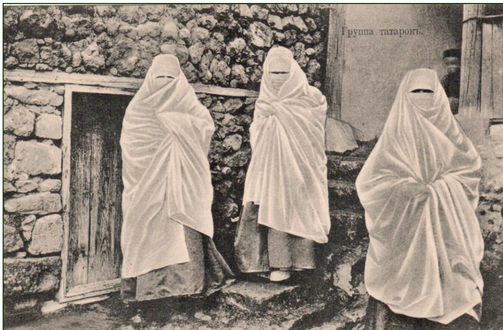
Рис. 8. Верхнее безрукавное наголовное покрывало «фередже». Крымские татары, начало XX в. / «Группа татарок». Типы крымских татар. Почтовая открытка.