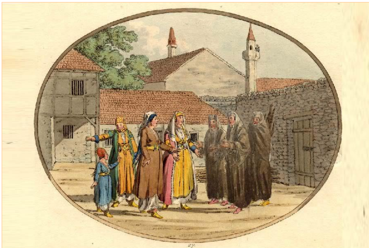
Рис. 3. Верхнее халатообразное наголовное покрывало «фередже». Крымские татары. Конец XVIII – начало XIX вв. / Х.-Г. Гейслер. «Татарские женщины». Бумага, раскрашенная гравюра (1799-1801).